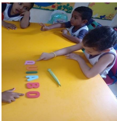
Figura 5 – Apresentação do quiabo em sala de aula, para iniciar a roda de conversa com as crianças da Educação Infantil, E.M.E.I.E.F. Antônio de Souza Santos