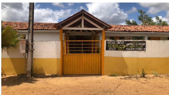
Figura 1: E.M.E.I.E.F. Antônio de Souza Santos

Desse modo, a E.M.E.I.E.F. Antônio de Souza Santos, tem recorrido ao método da Pedagogia de Projetos como proposta para abraçar as especificidades construídas no Assentamento Garapú II, como proposta curricular, especialmente pela necessidade de contextualizar uma escola do campo, sua localização em assentamento rural da reforma agrária, o contexto dos povos camponeses assentados da reforma agrária e dos movimentos sociais dentre outros, e assim partimos da situação e do lugar desses sujeitos, conforme demonstram as imagens seguintes: