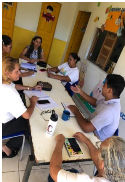
Figura 3 – Reunião de planejamento para elaboração do Projeto Horta Familiar na E.M.E.I.E.F. Antônio de Souza Santos no Assentamento Mata de Garapú II, Conde, Paraíba, Brasil