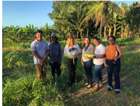
Figura 4 – Visita à casa do Senhor Everaldo no Assentamento Mata de Garapú II para conhecer a prática do cultivo de hortaliças