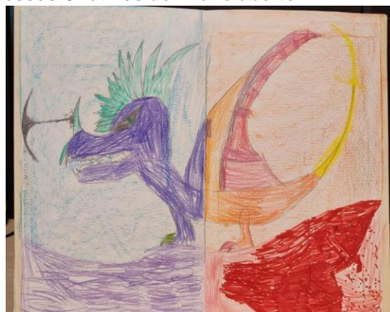
3 e 4