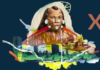
Figura 3 e Figura 4 – Caderno de Processos Criativos do 2º ano aberto.