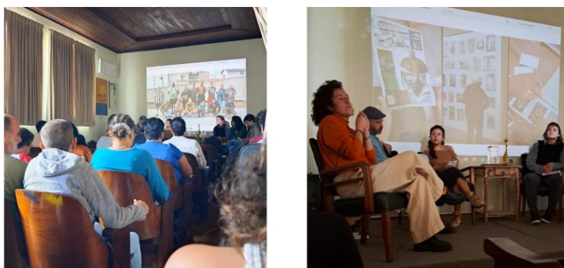
Figura 2. Mesa de Conversa no Fórum da Cultura