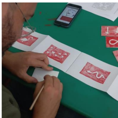
Figura 1. Processos em Isogravura

O ponto de partida da proposta foram as experiências acumuladas nas oficinas realizadas durante o estágio no CAPS AD III e o interesse em desenvolver um trabalho com gravura. A percepção do efeito que as medicações e a abstinência causam no corpo (como tremores nas mãos, por exemplo) fez da Isogravura uma boa solução técnica encontrada para a proposta. Ela consiste em uma técnica de impressão em que é usada uma placa de isopor como matriz e qualquer material rígido, para a criação dos desenhos a serem impressos. Nesta proposta há grande praticidade técnica, não necessita do uso de materiais cortantes para criação da matriz da gravura e há facilidade de reuplicação em outros espaços externos à oficina. Contribuindo, desta forma, para autonomia criativa dos participantes.