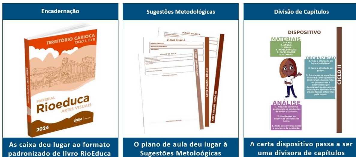
Figura 2. Material após alterações

mesmo ciclo, um docente poderá orientar-se por objetivos, adaptações à faixa etária e avaliações distintas, mesmo trabalhando uma mesma habilidade. 6