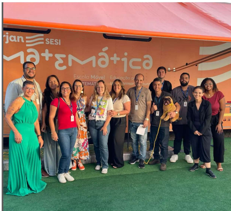
Figura 2: Formação continuada.