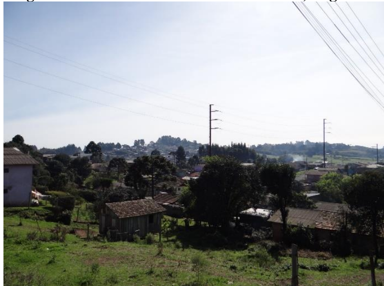
Figura 2 – Vista do interior da Cidade Alta, Lages/SC.

É em meio a galpões industriais e torres de transmissão que vivem os caboclos, com seu modo de vida muito mais harmônico com a Natureza do que a “modernidade” industrial. Esta fusão resulta em uma paisagem urbana complexa por seus contrastes e contradições, como é possível visualizar na fotografia da Figura 2 e no desenho da Figura 3.