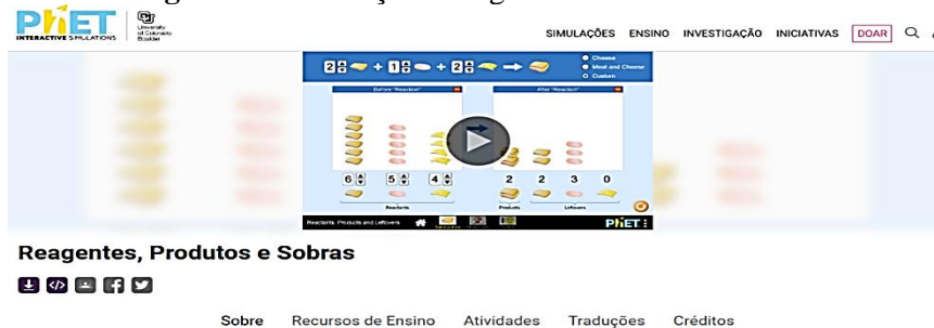
Figura 2 – Simulação “Reagentes Produtos e Sobras”