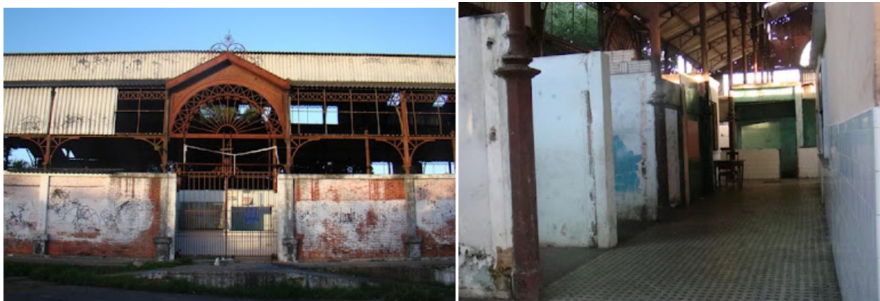
Figuras 5 e 6: Mercado da Aerolândia antes da intervenção.

Por se localizar em uma área periférica da cidade, tornou-o um importante símbolo de resistência para a comunidade, valorizando-o enquanto patrimônio cultural e marco da região. O equipamento manteve o uso comercial ao longo dos anos, mas funcionando bastante precariamente por conta do crítico estado de conservação (Figuras 5 e 6).