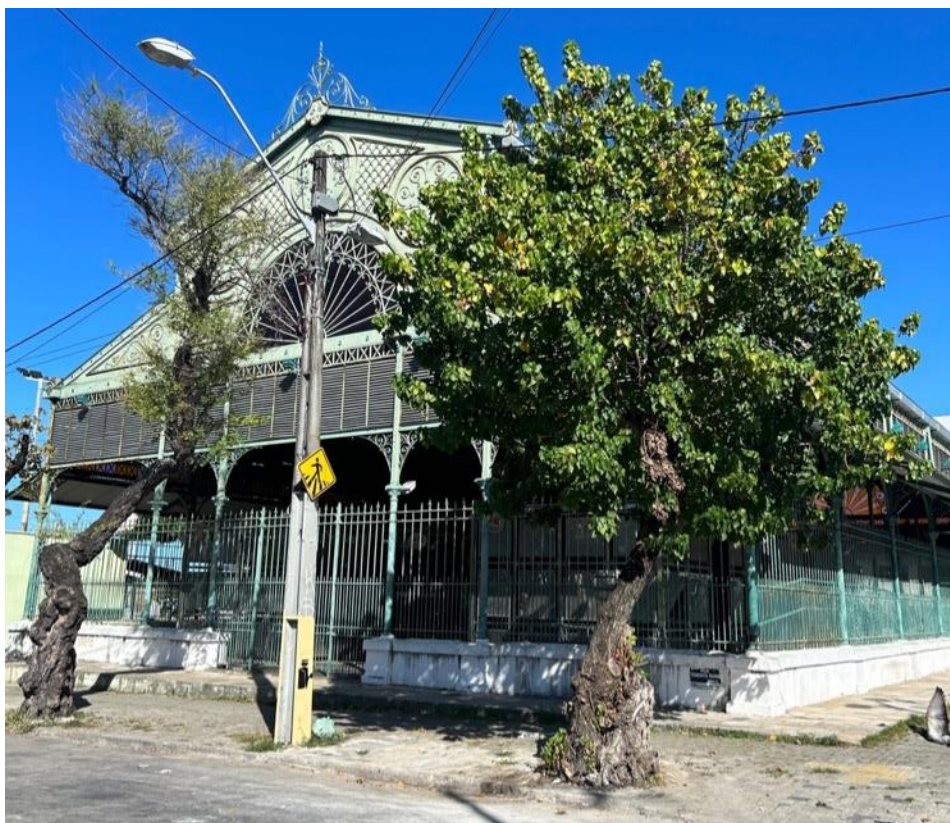
Figura 9: Mercado da Aerolândia. Fonte: Autora. (2023)

Em abril de 2024, o secretário Samuel Dias, da Seinf, comunica à sociedade fortalezense um projeto de reunificar os mercados em um espaço diverso de onde estão atualmente localizados e de onde um dia sequer foram localizados (Figuras 10 e 11). Os mercados passariam a se posicionar em um terreno no entorno da Praça Pelotas, atual endereço do Mercado dos Pinhões. Samuel Dias sinalizou que a licitação seria lançada no segundo semestre e que as obras com duração de 18 meses seriam iniciadas ainda em 2024.