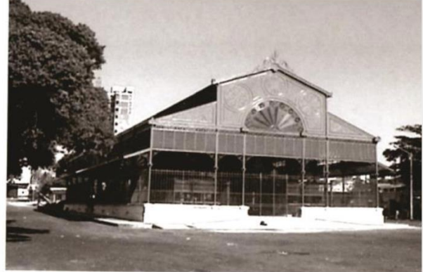
Figuras 2 e 3: Mercado dos Pinhões antes e após o restauro no início dos anos 2000.

Durante o processo de restauro, o Mercado dos Pinhões teve sua estrutura metálica quase intacta, porém as principais modificações realizadas foram as seguintes: a troca das venezianas de madeira existente por chapas de zinco e a recuperação dos vitrais. Para Capelo Filho e Sarmiento (2003), como não foi encontrada nenhuma peça original para a restauração destes elementos, tomou-se a decisão pela adoção de uma veneziana de secção retangular com arestas vivas; os vitrais lineares passaram a ser formados por ferro cruzados em “X” arrematado com uma flor ao centro, e os vitrais semicirculares passaram a ter uma forma de leque com elementos decorativos.