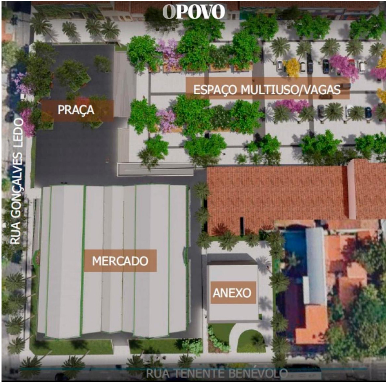
Figura 10: Implantação dos Mercados no entorno da Praça Pelotas.