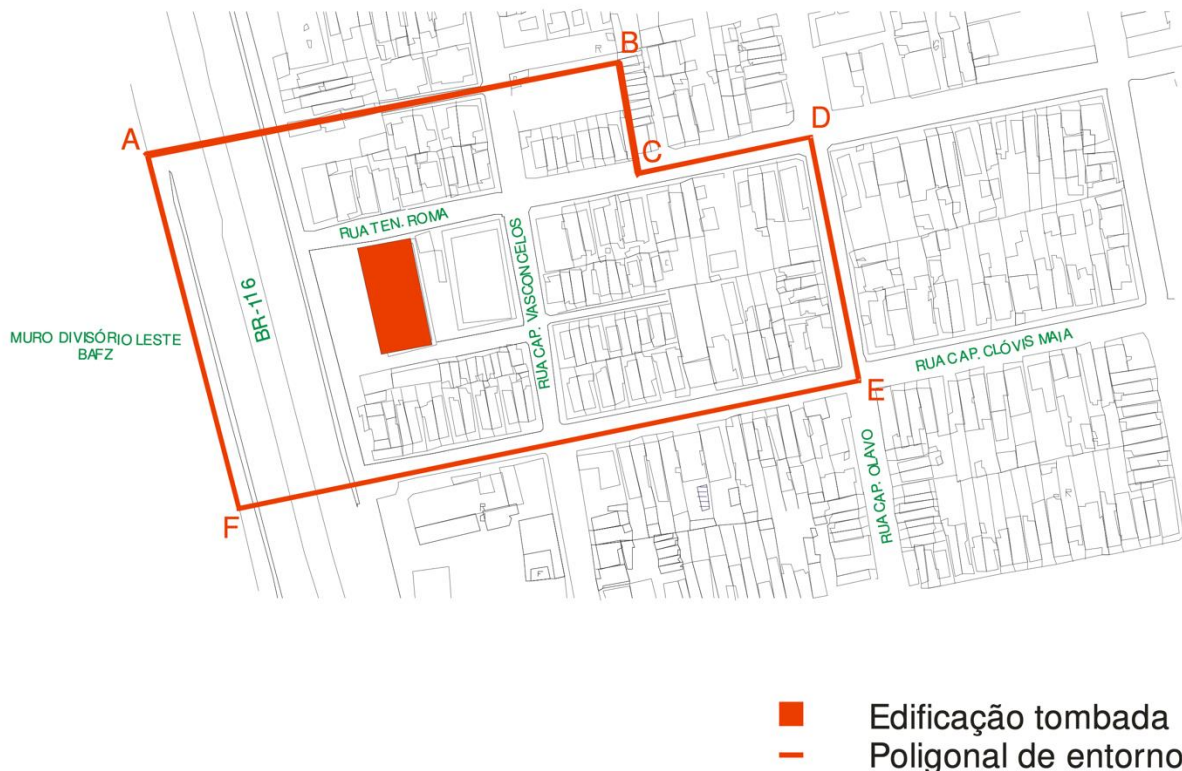
Figura 7: Poligonal de entorno do Mercado da Aerolândia.

No documento estabeleceu-se o reconhecimento da trajetória histórico-cultural do bem, além de estabelecer uma poligonal de entorno (Figura 7) e determinar recomendações e diretrizes para a preservação do imóvel.