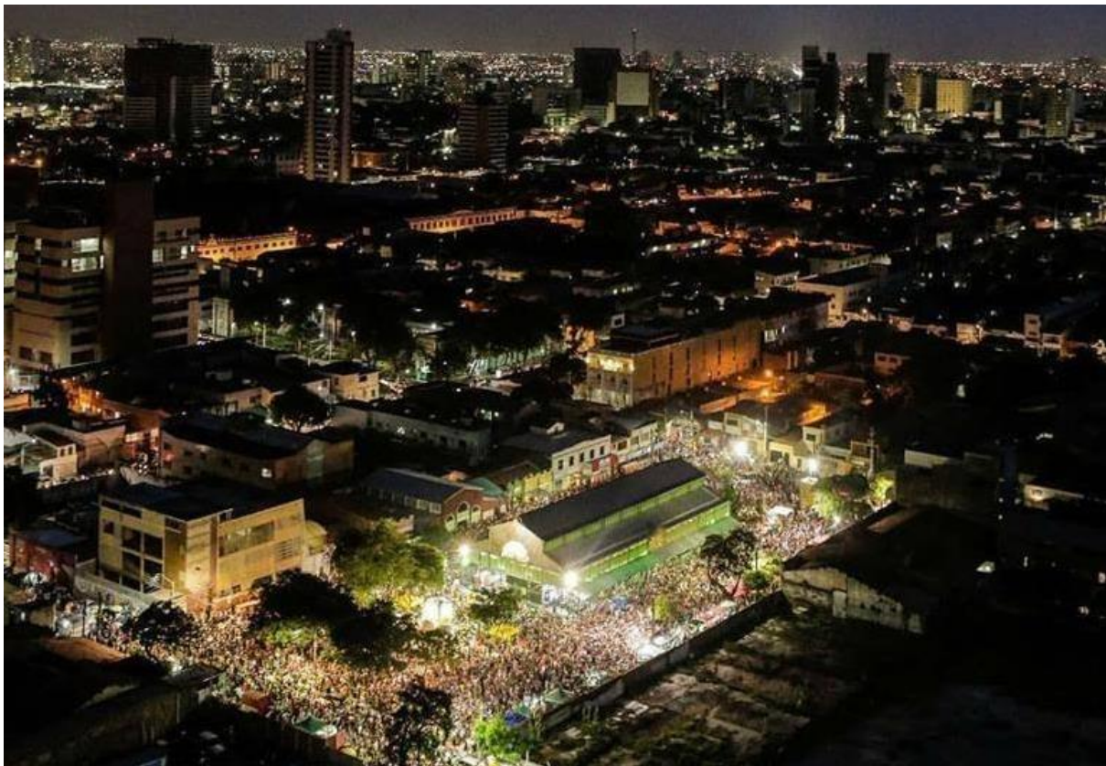
Figura 8: Mercado dos Pinhões no Carnaval.

E assim caminharam os Mercados-Irmãos por quase uma década, tornando-se satélites em seus territórios sobretudo nas festividades, recebendo feiras livres, eventos musicais etc. Constata-se que há historicamente uma diferenciação de cuidado entre eles. O dos Pinhões, localizado na área nobre da cidade, tem seus danos físicos devido à utilização intensa do espaço, há mais cobrança por manutenção e reparos, programação cultural, dentre outros. O da Aerolândia, apesar de ter sido restaurado bem mais recentemente, está em condições precárias de manutenção e encontra-se fechado (Figuras 8 e 9).