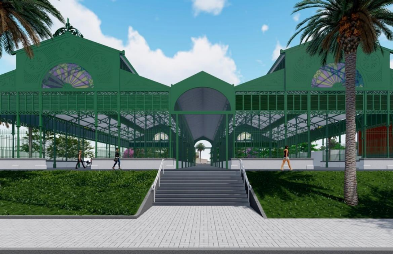
Figura 11: Pavilhões dos Mercados unificados. Fonte: Prefeitura de Fortaleza. (2024)

Salienta-se que a proposta caminha de encontro ao que está estabelecido em documentos internacionais como a Carta de Veneza de 1964, cuja recomendação estabelece que um bem é indissociável do seu lugar, excetuando em casos extremos que implique numa eminente perda do bem (Icomos, 1964). Por mais que se possa questionar que outrora os pavilhões eram conectados, para a sociedade contemporânea, eles não são mais reconhecidos enquanto um único Mercado de Ferro, mas pelo contrário, são dois equipamentos distintos e que exercem influência em seus territórios como estão desde o final da década de 1930.