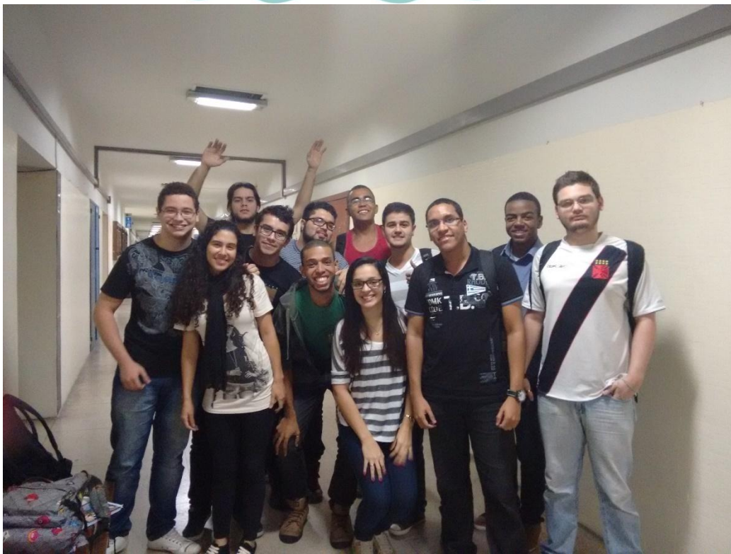
Figura 2 – Turma (incompleta) de calouros de Licenciatura em Química.

A construção do cenário atual tem origem na história do Brasil, no processo de dificultar e de impossibilitar a escolarização e inserção social da população negra. Desde a transição do trabalho escravo para o trabalho livre no século XIX houve restrições para os negros, produzindo efeitos sociais devastadores e que hoje são identificados e quantificados. Segundo De Barrosi (2016, p. 594), “a Constituição de 1824 determinava: ‘A instrução primária é gratuita para todos os cidadãos’ (BRASIL, 1824), porém entre os cidadãos estavam excluídos os escravizados. Mais tarde, o Decreto Couto Ferraz de 1854, que regulamentava o ensino primário e secundário da Corte instituía que no ensino primário “não serão admitidos a matrícula, nem poderão frequentar as escolas: [...] §3º. Os escravos”. A interdição também era para a instrução secundária (De Barrosi, 2016, p. 596).