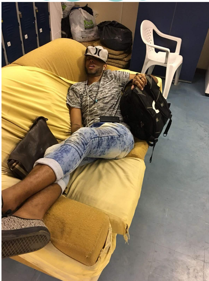
Figura 3 – Início do semestre letivo.

Foram muitos os atravessamentos vivenciados a cada semestre, o ser o primeiro da família a conseguir ingressar em uma universidade como a UFRJ, a dúvida em conseguir terminar, a incerteza de efetiva ascensão social e econômica.