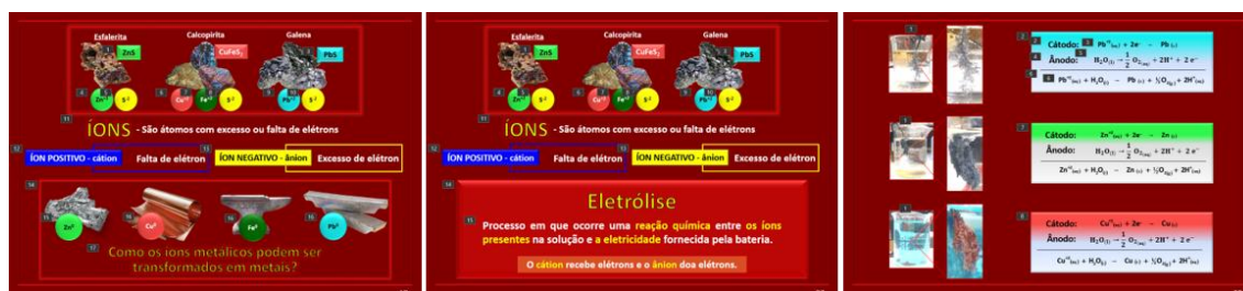
Figura 2 – Slides usados na etapa de emersão.

Na etapa de imersão, pelo menos um aluno em cada turma não sabia que o robô na imagem possuía metal em sua estrutura, permitindo discutir a presença de metais em outros objetos, como no celular e computador. Na turma A, o envolvimento da aluna A1, encorajando o engajamento dos colegas, impressionou os oficinairos. Na turma B, quando a equipe mostrou exemplares de diversos minérios, a aluna B1 estarecida os tocou e questionou “como essa pedra pode virar ferro?”, ficando inquieta até finalizar os experimentos de “árvores de metais”, na emersão. Quando debateram a respeito das condições de trabalho nas minas apresentadas, o aluno B2 foi preciso ao dizer que aquelas pessoas não estavam utilizando EPIs (Equipamento de Proteção Individual). Já os alunos da turma C, além da falta de segurança, discutiram e concluíram que aqueles trabalhadores não possuíam uma remuneração digna em relação ao trabalho árduo realizado, afirmando que sofriam exploração. Todos demonstraram indignação com o desrespeito aos mineradores e a extensão da destruição ambiental causada pela mineração, mas não sabiam como mudar essa situação.