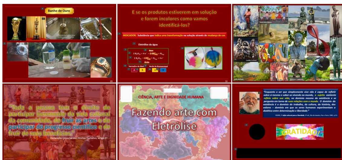
Figura 3 – Slides usados na etapa de reimersão.

questionar “como se transforma a pedra em solução para extrair os íons?”. Até os alunos antes relutantes em participar, engajaram-se fazendo colocações pertinentes durante a experimentação, inclusive ajudando na construção da explicação ao final. Apesar da equipe ter testado os equipamentos e reagentes, não foi obtido o resultado esperado com a solução de sulfato de chumbo; todavia, ao exibir o slide 8, que também tinha uma imagem com esse experimento, os alunos ficaram admirados com o formato do produto, pois o chumbo fica semelhante a folhas de uma árvore, iniciando a construção da relação observação-admiração entre a química e a arte.