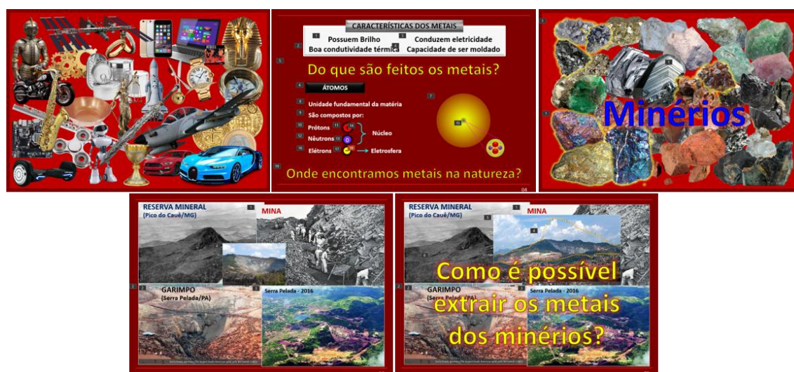
Figura 1 – Slides usados na etapa de imersão.

A OI-FAE foi realizada no dia 21 de junho de 2024 nos horários: 8:40 a 10:20h – turma A; 10:35 a 12:15h – turma B; e, 14:40 a 16:20h – turma C. Na ocasião, a turma A já havia participado de uma OI de física, sobre a vida de Faraday e a indução eletromagnética; e, as turmas B e C, além dessa, haviam realizado uma OI de Biologia sobre alcoolismo e alcoolismo fetal. Durante as aplicações, 3 licenciandos em Química atuaram como oficinairos e 1 como monitor, e como observadores participantes, supervisionados por um pesquisador do grupo. Seus relatórios foram usados para proceder as análises das realizações e a da ação pedagógica dos licenciandos. O material audiovisual de apoio consistiu em conjunto de slides elaborados com os recursos de animação do Powerpoint, cujas miniaturas são apresentadas nas Figuras 1 a 3, excluindo-se os slides de capa e apresentação da equipe.