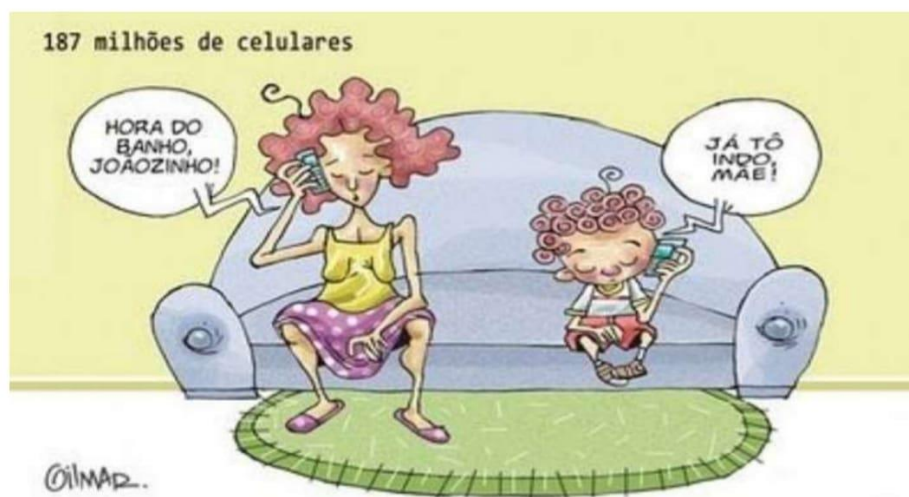
Figura 3: mãe e filho usando smartphone

demarcaram claramente uma postura redutora de danos, também poderiam favorecer uma percepção danosa do fenômeno pelo uso de palavras como “problemas” e “comportamentos comuns”. Dessa forma poderiam limitar uma leitura multifatorial como a sinalizada por Coelho, Monteiro e Luz (2021). A imagem que a cursista utilizou é reproduzida na figura 3: