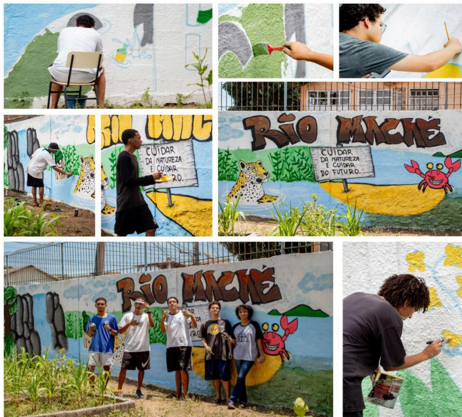
Figura 4. Quadro de fotos de álbum de fotos produzido durante a construção do mural

Nessa proposta, o documentário foi produzido, se iniciando com uma escrita argumentativa, onde procurei responder as questões que me incomodavam e determinar os objetivos e estratégias. Posteriormente construí uma escaleta, onde teria uma base para a fotografia, filmagem, montagem de som e edição.