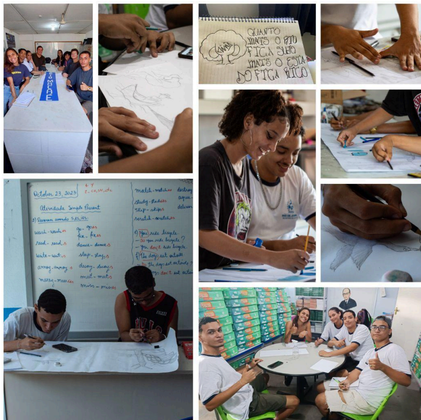
Figura 2: Quadro de fotos da produção do mural

Os primeiros humanos já utilizavam de paredes, pedras, tintas extraídas de plantas, cascas e frutos para expressar não apenas suas inquietações, mas suas tradições e necessidades momentâneas. As paredes nos ensinaram a ler, contar e a se comunicar. (Barchi, 2006, p.5) traz um argumento inovador, até por seu viés incômodo. Ele propõe que a pichação possui “potencialidade de arte e intervenção política anônima, utilizada na proposta de sociedades mais justas, solidárias e ambientalmente sustentáveis”. Problemas provenientes do capitalismo direcionam essa relação, onde o processo de aprendizado é