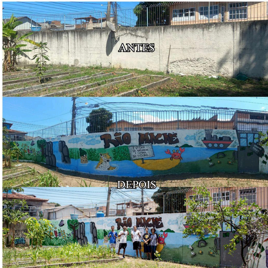
Figura 3. Antes e depois do muro