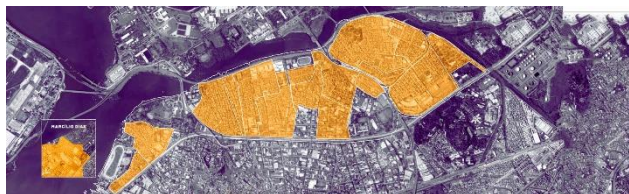
Imagem 1: Mapa da Maré

O trabalho apresenta as práticas de educação popular em saúde realizadas nos anos de 2020 e 2021 durante a Campanha "Vacina Maré", que buscou promover a conscientização sobre a importância dos cuidados em saúde e da vacinação entre a população da Maré, bairro da zona norte da cidade do Rio de Janeiro. Por meio de estratégias de mobilização comunitária, educação popular e a integração entre Ciência e Saúde, a campanha teve o objetivo de ampliar a cobertura vacinal contra COVID-19 e, conseqüentemente, criar melhores condições de saúde para a comunidade.