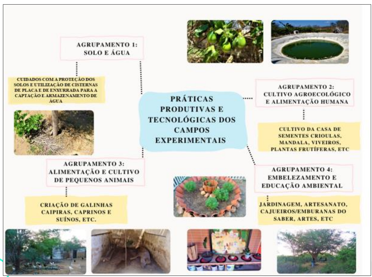
Figura 3 - Agrupamento de práticas produtivas e tecnologias no campo experimental Dom Fragoso - Escola Florestan Fernandes, Assentamento Santana, CE, 2022

Assim como produzir conhecimentos e desenvolver abordagens interdisciplinares, a escola tem o desafio de se manter na tarefa do trabalho com a agroecologia. Trata-se de algo difícil em um tempo histórico no qual o fastfood ganha muito mais adesão da sociedade. Silva (2017) agrupou as principais práticas agroecológicas dos campos experimentais em quatro itens: solo e água; cultivo agroecológico e alimentação humana; alimentação e cultivo de pequenos animais e embelezamento e educação ambiental. No campo experimental Dom Fragoso da Escola Florestan Fernandes, foram encontradas estratégias pedagógicas correspondentes ao agrupamento proposto por Silva (2017), conforme sistematizado (Figura 3).