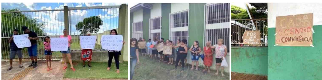
Figura 8 - Registro das manifestações: reforma da escola; abertura do Centro de Convivência; reforma do Centro Comunitário; respectivamente.

Ao final destes três encontros foi definido um conjunto de manifestações populares, que poderiam ocorrer nos bairros como encerramento da segunda fase. Assim, três dias de manifestações foram definidos, posicionados nos três locais com maior demanda indicada pelos moradores: na Escola Municipal Prof. a Maria Benedita Natália Lima (fechada à espera de reforma há 5 anos); no Centro de Convivência Angela M. Pires Caniato (abandonado) e na Praça Zumbi dos Palmares (principal centralidade, degradada). Apesar do número reduzido de moradores participando das manifestações, o resultado teve impacto, pois a estratégia de registrar depoimentos em vídeo e, posteriormente, divulgá-los em redes sociais, como o Instagram e Facebook, provocou algumas reações: a mais importante delas foi o anúncio da Prefeitura, sobre o retorno das obras na Escola. M. Benedita N. de Lima, constatado na semana seguinte às manifestações (figura 08).