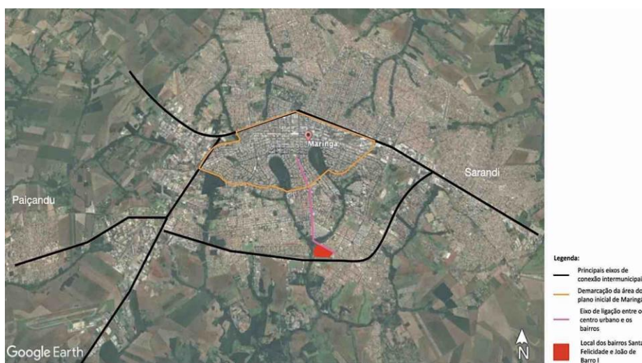
Figura 2 - Esquema de localização dos bairros no contexto urbano.

Em 2008, malha urbana havia se expandido e alcançado o bairro, trazendo equipamentos urbanos e bairros de padrões mais elevados, assim o bairro Santa Felicidade foi selecionado para receber investimentos advindos do PAC - Programa de Aceleração do Crescimento voltado à áreas de favelas, mesmo que não configurasse assim, como ressalta Souza (2018). Decorrente disto, surgiu o PAC ZEIS Santa Felicidade. Esta ação se refletiu como um claro processo de higienização do local, revelando o recorrente preconceito sobre a comunidade, ao mesmo tempo, fazendo parte de mais um capítulo do processo de segregação sócio-espacial característico do desenvolvimento urbano de Maringá, iniciado na década de 1970 (Silva, 2015). O resultado foi a remoção de parte da comunidade do local, com o argumento da unificação dos terrenos para ampliá-los, além da construção de dois barracões para atividades de cooperativa