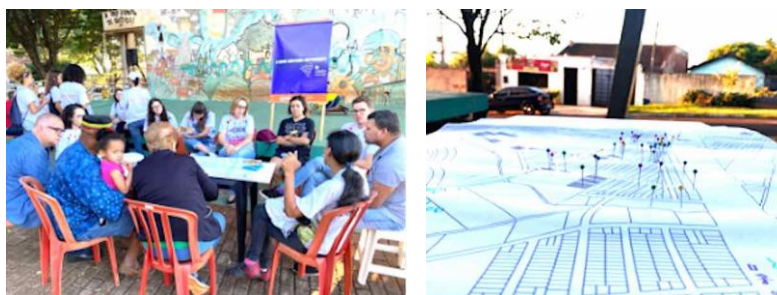
Figura 6 - Dinâmica "a cidade real". Fonte: Acervo das autoras, 2023.

Para investigar o entendimento sobre "a cidade real", lançou-se mão da cartografia social, ferramenta associada ao planejamento e transformação social, utilizada (ainda que não largamente) na investigação ação-participativa e desenvolvimento comunitário (Landim Neto et al , 2013 apud Costa, 2016). Soma-se ao processo de planejamento numa perspectiva participativa a partir da conexão entre os grupos sociais como o seu território (Acsehrad; Coli, 2008 apud Costa, 2016). Os participantes localizaram, no mapa colaborativo, os locais mais importantes dos bairros, seus problemas e suas vocações, os lugares de afeto e desafeto e as demandas e potencialidades dos bairros (figura 06). A partir deste terceiro encontro pode-se perceber que, de fato, os espaços de convívio e equipamentos públicos comunitários são apontados como positivos, ou seja, são importantes para manutenção da convivência entre seus moradores e teriam urgência de reabertura, como por exemplo o Centro de Convivência. Em seguida citaram o comércio e ruas que passaram pelas obras do PAC. Os pontos negativos mais ressaltados foram a não manutenção da escola municipal e centro de convivência, ambos sem atividade no momento, a transferência do Centro Municipal de Educação Infantil para outro bairro e as várias calçadas irregulares.