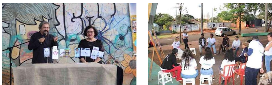
Figura 4 - Apresentação de teatro e dinâmica "a cidade sentida", respectivamente

Nesse primeiro encontro, o projeto do PAC, veio à tona através de relatos sobre o impacto do mesmo nos laços da comunidade, a herança de obras inacabadas e a falta da prometida documentação de regularização fundiária de alguns moradores. Também foi destaque o processo de desativação/abandono dos equipamentos públicos, onde os moradores relataram o descaso, tanto do presidente de bairro (eleito há quase uma década, mas ausente das demandas) como da gestão pública. Mesmo com estes pontos negativos, a união da comunidade foi constantemente mencionada.