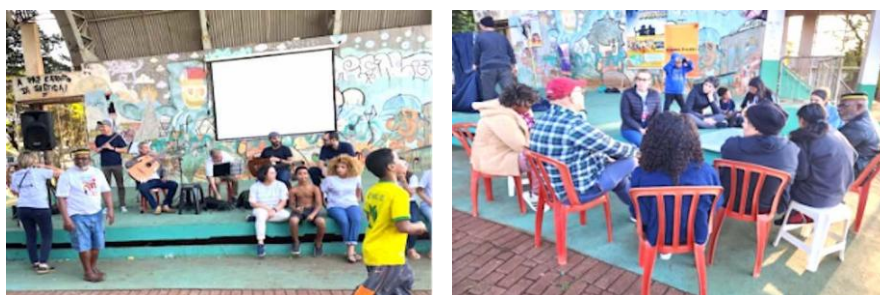
Figura 07 - Apresentação de música e dinâmica “a cidade viva e desejada”, respectivamente.

O quarto, último encontro, aconteceu com a dinâmica da “cidade viva e desejada”, teve o objetivo de identificar as potencialidades dos bairros, apontar os desafios para melhorias ocorrerem, indicar quais apontamentos dependiam da população, da gestão ou seriam possíveis serem realizados em conjunto. Novamente, os participantes relataram como potencialidade a boa relação de vizinhança e o histórico de luta das duas comunidades, o que promoveu inclusive a diminuição na criminalidade, após a remoção de 1/3 das famílias em decorrência do PAC. Esta dinâmica tinha o objetivo de se constituir como a fase de diagnóstico, porém dada a ânsia de debater melhorias urbanas pelos moradores, surgiram sugestões como: pintura dos muros das casas nos arredores da praça Zumbi dos Palmares; execução de paisagismo nos espaços públicos; mobilização comunitária e nova eleição para a presidência de bairro (figura 07).