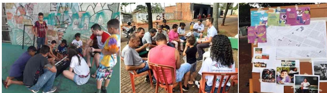
Figura 5 - Vivência musical e dinâmica "cidade sentida", respectivamente.

os bairros representam para eles (figura 05). O objetivo foi o de incentivar a troca de saberes e experiências entre os participantes, e, identificar percebem seu território. A relação entre os moradores e com os bairros do entorno, também, foi abordada com comentários sobre a qualidade do comércio local e do transporte público que, segundo os participantes, está melhor atualmente.