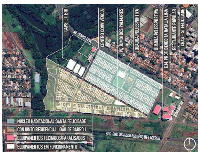
Figura 3 – Localização dos equipamentos públicos, existentes após PAC, no Conjunto Residencial João de Barro I e Núcleo Habitacional Santa Felicidade, mas parcialmente em funcionamento em 2023.

de catadores de material reciclável (não mais ativo); um barracão para cooperativa de geração de empregos, não executado; a construção do Centro de Atendimento Psicossocial Infanto-juvenil (CAPS - I); um centro de convivência comunitário (hoje abandonado); a reforma do Centro de Referência de Assistência Social (CRAS) Santa Felicidade; e a remodelação da Praça Zumbi dos Palmares, hoje à espera de uma reforma (Jordão, 2012; figura 03). Tais investimentos, embora controversos, geraram a premiação do Selo de Mérito, em 2013, para a cidade de Maringá, que aconteceu durante o 60º Fórum Nacional de Habitação de Interesse Social.