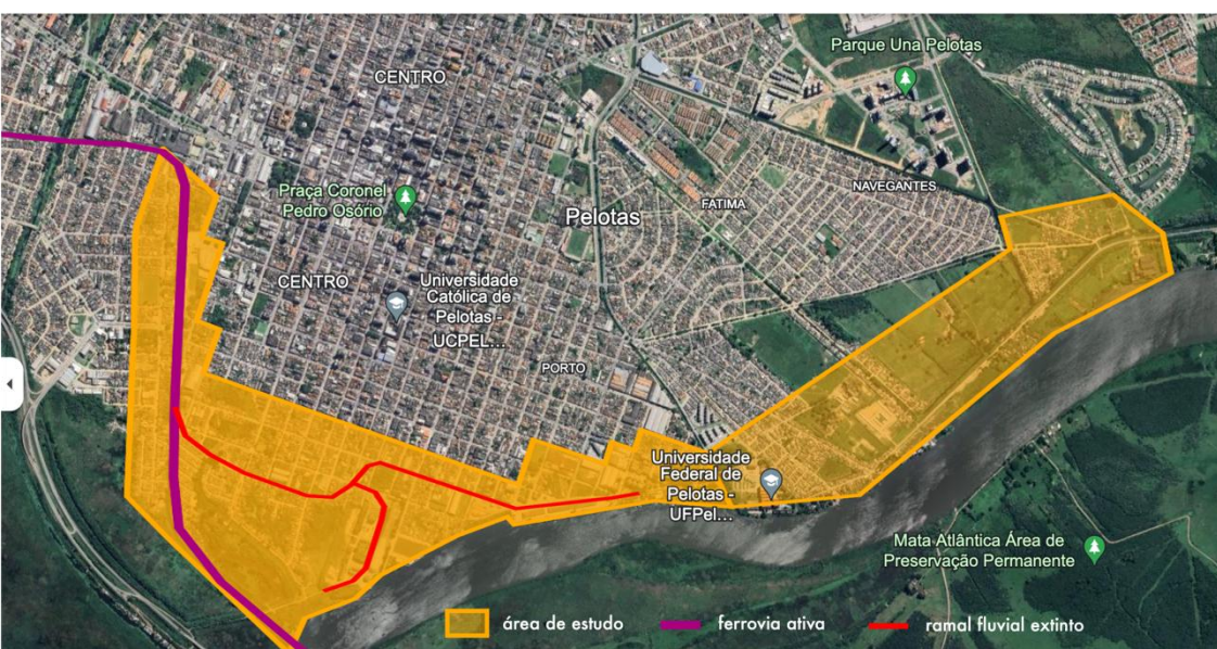
Figura 1 - mapa de Pelotas destacando a área de estudo

Depois do desafio que foi a delimitação de uma área de estudo que abrangesse os mais diversos interesses de pesquisa, indagações e temáticas dos integrantes do projeto, partiu-se para a organização conceitual, metodológica e logística da pesquisa. O arranjo conceitual é descrito a seguir.