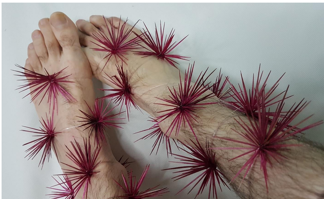
Imagem 3. Sandro Bottene, Sem título – Dolor Studium (Série Garoto-cacto), Fotografia Digital, dimensões variáveis, Seberi, RS, 2021.