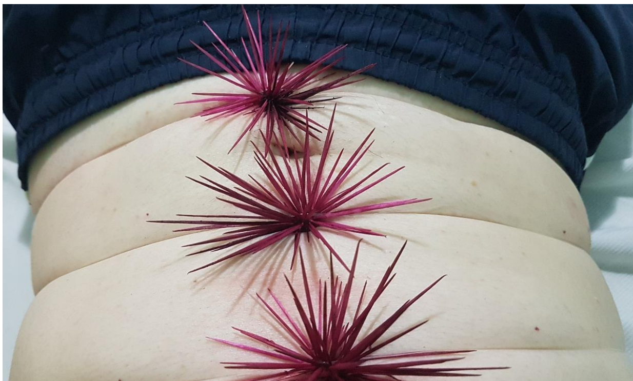
Imagem 6. Sandro Bottene, Sem título – Dolor Studium (Série Garoto-cacto), Fotografia Digital, dimensões variáveis, Seberi, RS, 2021.