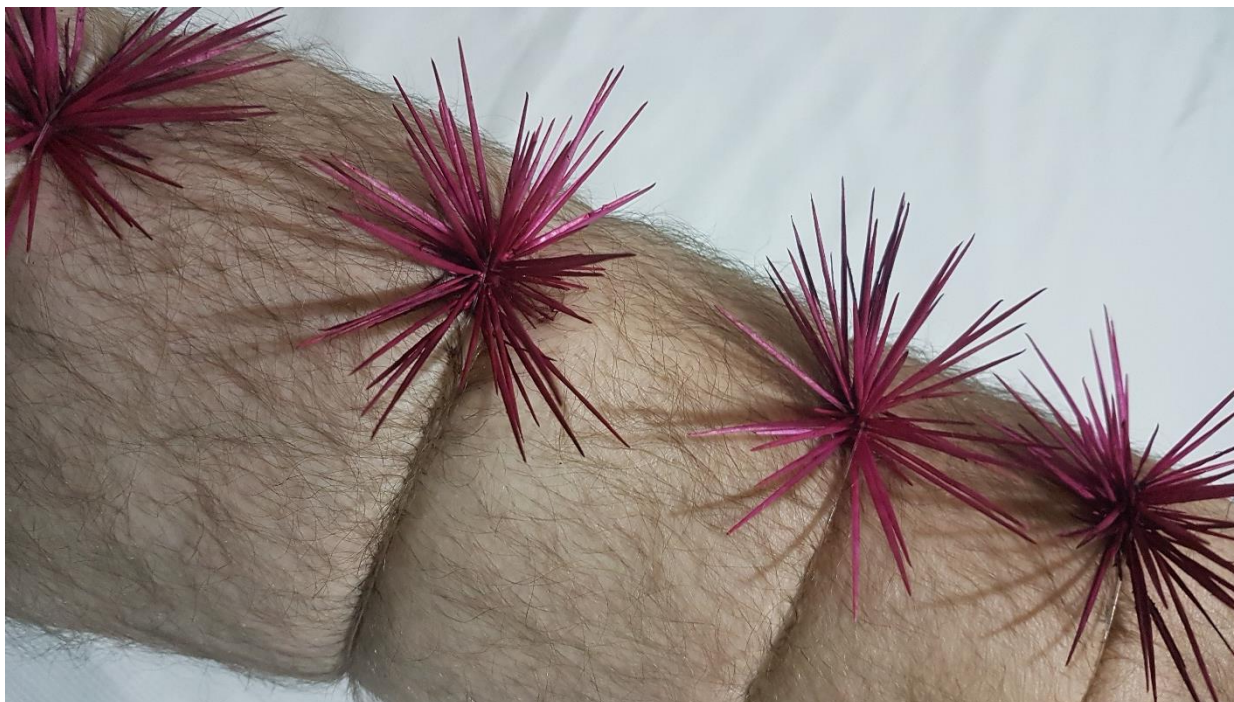
Imagem 5. Sandro Bottene, Sem título – Dolor Studium (Série Garoto-cacto), Fotografia Digital, dimensões variáveis, Seberi, RS, 2021.