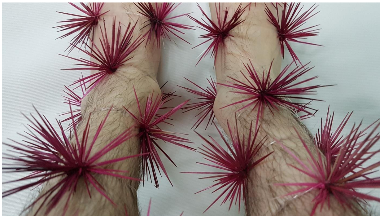
Imagem 2. Sandro Bottene, Sem título – Dolor Studium (Série Garoto-cacto), Fotografia Digital, dimensões variáveis, Seberi, RS, 2021.