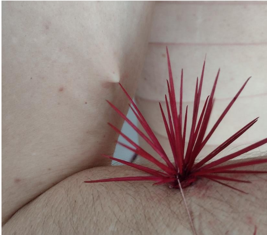
Imagem 8. Sandro Bottene, Sem título – Dolor Studium (Série Garoto-cacto), Fotografia Digital, dimensões variáveis, Seberi, RS, 2021.