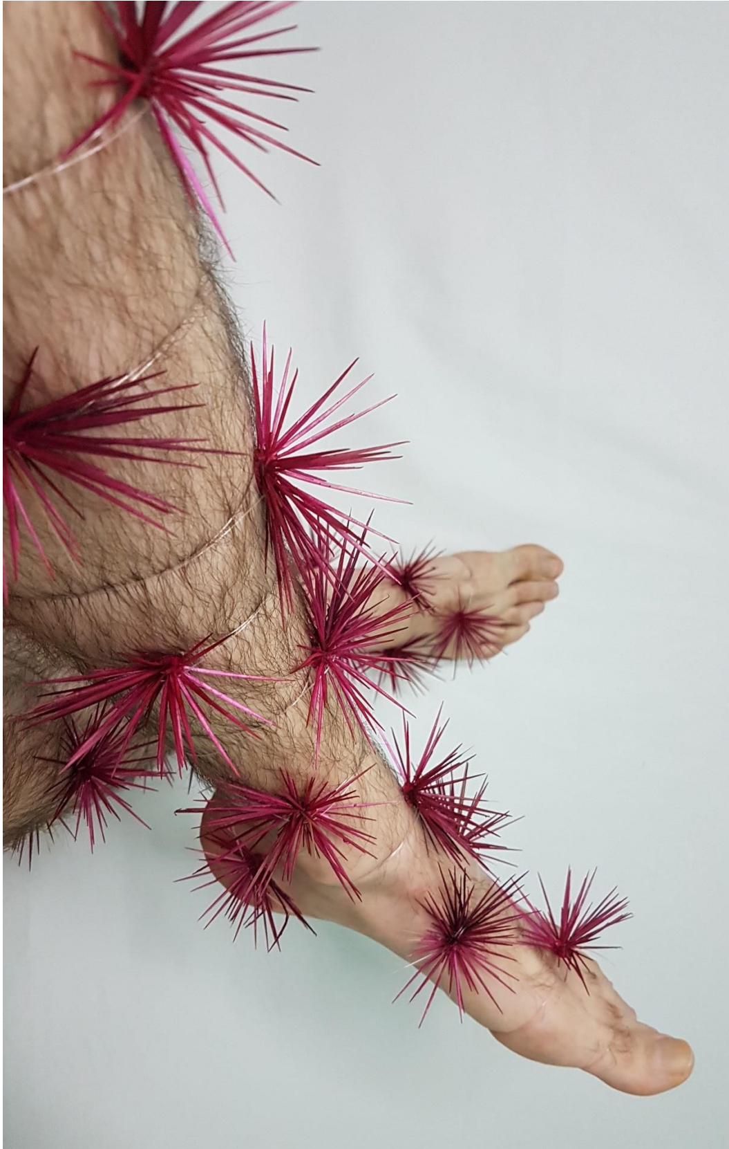
Imagem 4. Sandro Bottene, Sem título – Dolor Studium (Série Garoto-cacto), Fotografia Digital, dimensões variáveis, Seberi, RS, 2021.