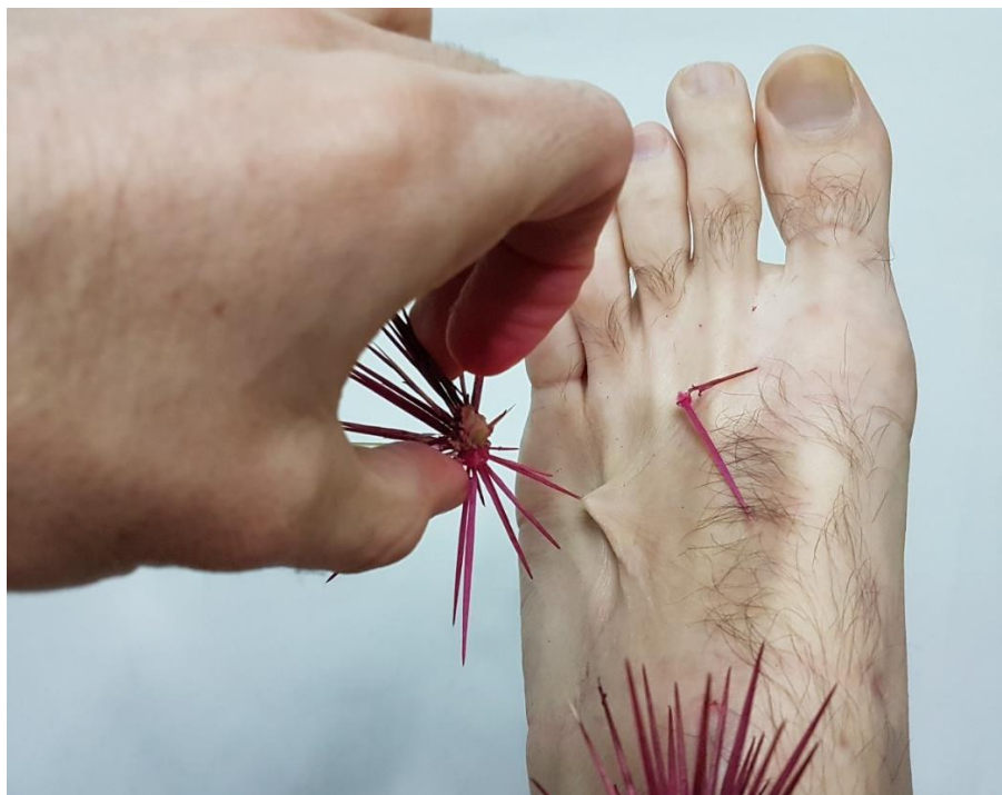
Imagem 9. Sandro Bottene, Sem título – Dolor Studium (Série Garoto-cacto), Fotografia Digital, dimensões variáveis, Seberi, RS, 2021.