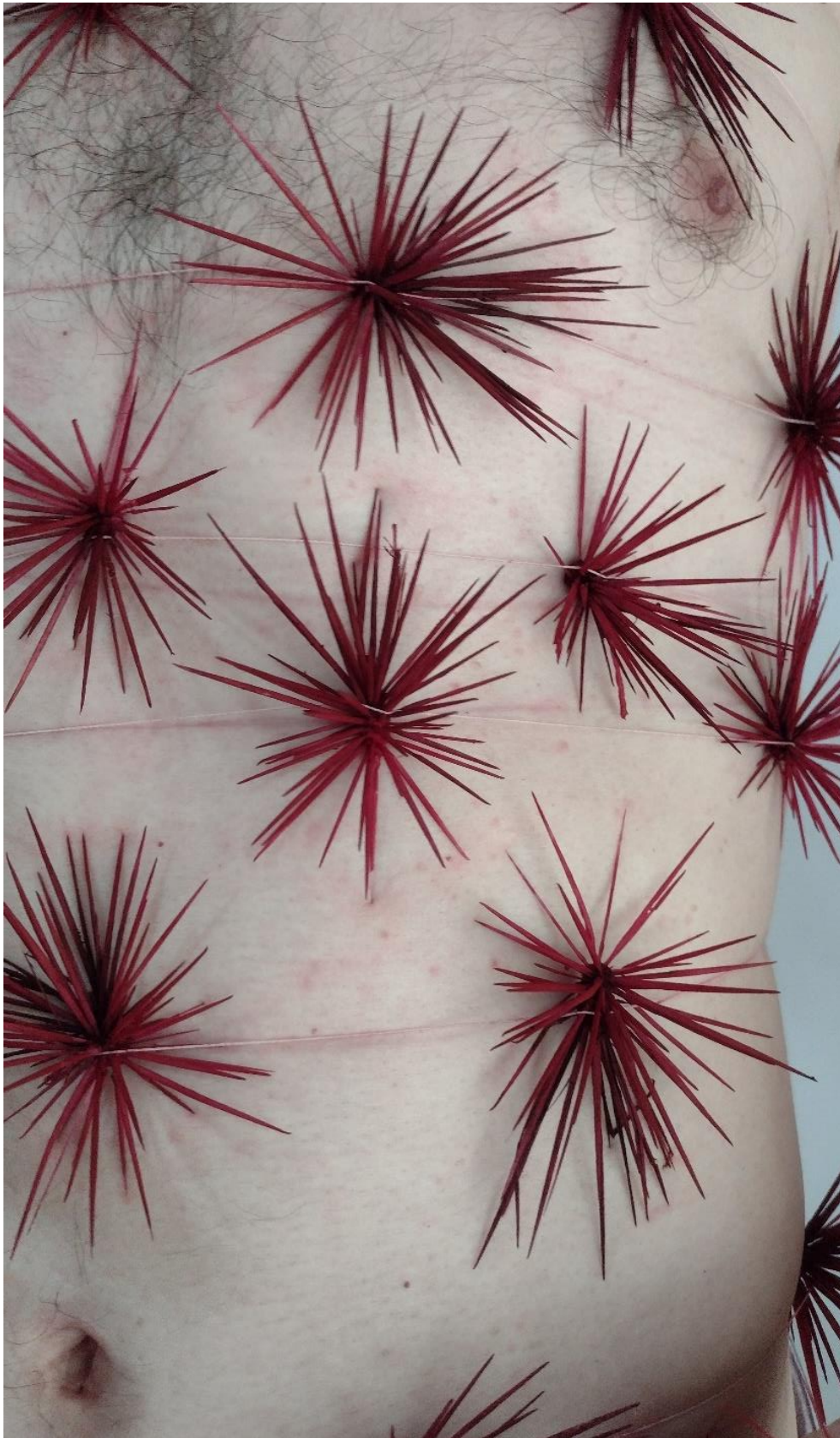
Imagem 7. Sandro Bottene, Sem título – Dolor Studium (Série Garoto-cacto), Fotografia Digital, dimensões variáveis, Seberi, RS, 2021. Foto: Eduarda Olechak, 2021.