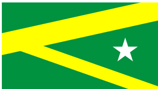
Figura 2: Bandeira do município de Marabá