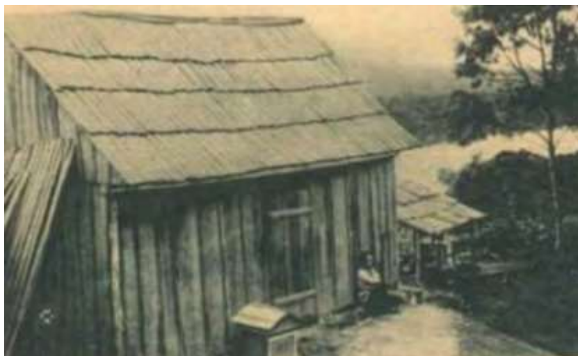
Figura 4: Casa Cabocla localizada na Colônia de Vera Guarany, distrito do Município de Paulo de Frontin - PR.

A denominada “Casa Cabocla” (figura 4) apresentava afinidade volumétrica com a arquitetura do imigrante, possuindo algumas variações relacionadas com o clima local e a ausência de ferramentas sofisticadas para a execução de entalhes e outros elementos. Possuía partido solucionado em planta retangular, tendendo ao quadrado, com dimensões reduzidas e compartimentação simples, geralmente subdividida em cozinha e um dormitório coletivo. Sua cobertura é alta e inclinada, apesar da ausência de neve na região, composta por tabuinhas de madeira.