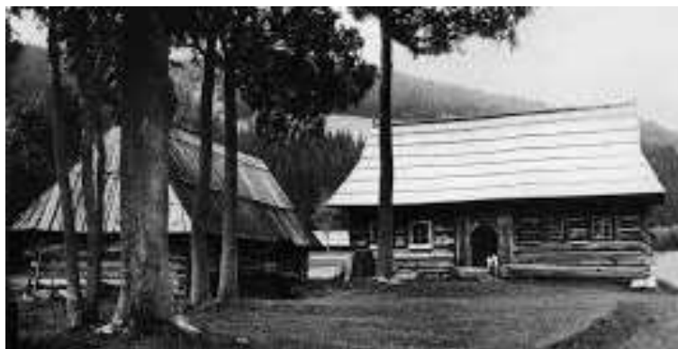
Figura 1: Casa em Podhale. Fonte: Banioska-Kopacz (2014, p.86)

Apesar da grande tradição em construção de madeira da população eslava, à época, as casas de tronco eram próprias de uma população mais empobrecida e rural, tendo em vista que em outras regiões, especialmente na Polônia, as famílias mais ricas e urbanas construíam suas edificações com tijolos de barro. No caso das casas de troncos da região de Podhale, a volumetria da residência é muito simples, composta por um prisma de base retangular, possuindo um telhado de grande inclinação alinhado ao lado maior do retângulo (figura 1) (BANIOWSKA-KOPACZ, 2014).