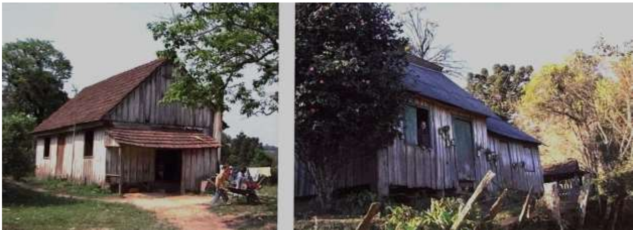
Figura 5: Exemplares de Casas de Esteios.

A arquitetura produzida pela população local, influencia fortemente a população de imigrantes eslavos, que, aos poucos abandona o sistema dom wegowy e adota um novo sistema, inspirado pelas soluções caboclas, especialmente pela adoção de tábuas no sentido vertical. Esse novo método ficou conhecido como “casa de esteios” (figura 5), pois possuía esteios enterrados no solo como elementos estruturais e sua vedação independente da estrutura. Apesar de indicarem a tentativa de racionalizar o consumo de madeira, ainda são visíveis nestas moradias elementos estruturais superdimensionados (LAROCCA JR; LAROCCA; LIMA, 2008).