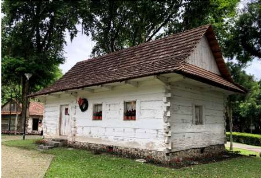
Figura 3: Casa de troncos em Curitiba, PR.

das peças, devido a inexistência de equipamentos mecânicos para a realização desta tarefa nas regiões de implantação das colônias (LAROCCA JR.; LAROCCA; LIMA, 2008).