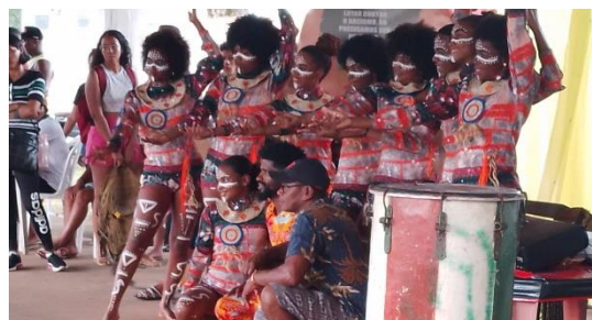
Imagem 4: Black Dance, Grupo de Dança da Comunidade