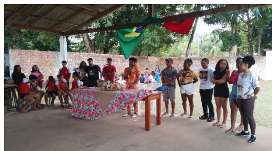
Imagem 1: Presidentes das comunidades, coordenador do programa e bolsistas