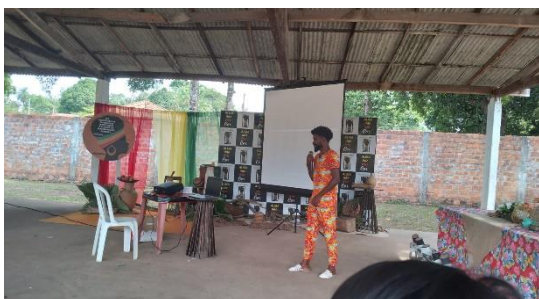
Imagem 2: Presidente da Comunidade Santa Maria do Muraiteua, Castanhal-PA

De acordo com o autor acima, destaca-se o papel fundamental da extensão universitária ao afirmar que ela permite a formação de profissionais cidadãos. Destacando que a extensão se torna, progressivamente, um espaço essencial para a produção de conhecimentos relevantes na superação das desigualdades sociais. Dessa forma, a prática de extensão é vista como uma atividade acadêmica que conecta a universidade não apenas ao ensino e pesquisa, mas também às necessidades e demandas das populações. Logo, a extensão universitária não apenas contribui para a formação integral dos estudantes. Porém, desempenha um papel significativo no incentivo à igualdade social ao se envolver ativamente com a comunidade.