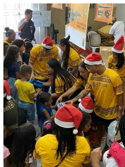
Imagem 14: Entrega de Presentes