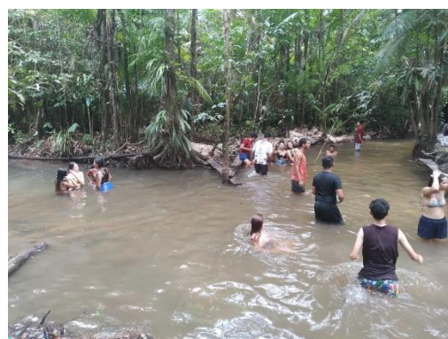
Imagem 16: Momento de Lazer