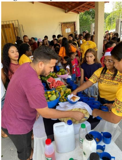
Imagem 13: Café da Manhã Coletivo