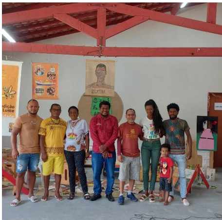
Imagem 11: Autoridades Presentes