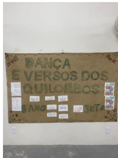
Imagem 8: Mural