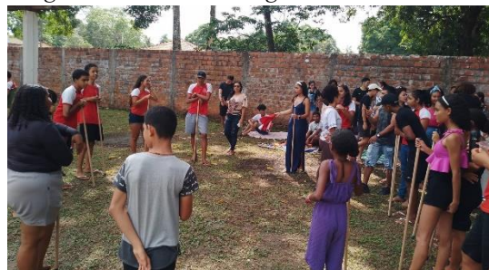
Imagem 6: Brincadeira Pegue o Bastão