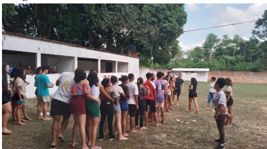
Imagem 5: Brincadeira Terra-Mar