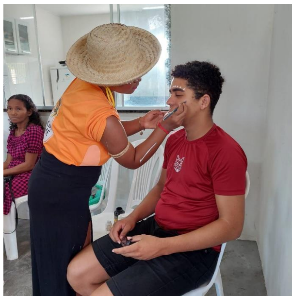
Imagem 10: Pintura Corporal