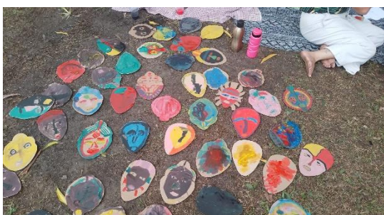
Imagem 3: Oficina de pintura de máscaras