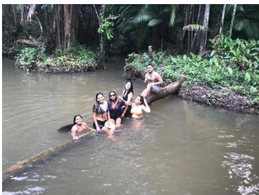
Imagem 15: Momento de Lazer