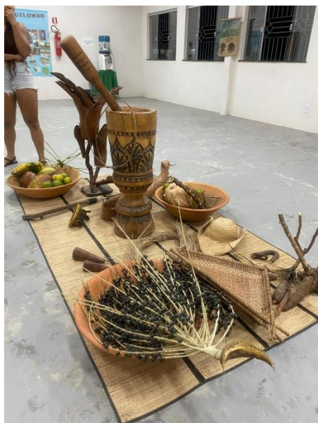
Imagem 9: Objetos do Cotidiano da Comunidade