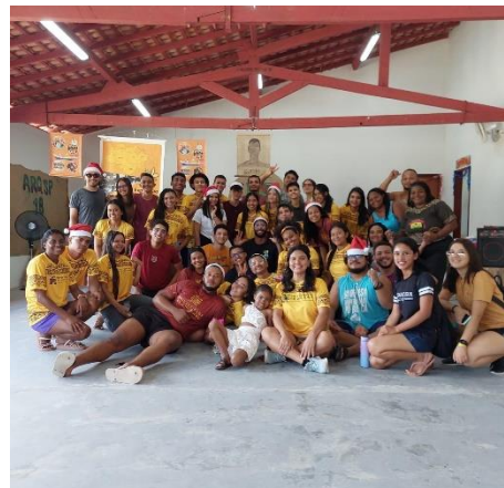
Imagem 12: Foto Oficial dos Bolsistas e Voluntários