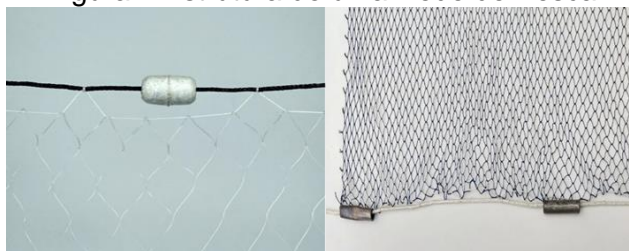
Figura I: Estrutura de uma Rede de Pesca

Na confecção de uma rede de pesca são utilizados fios de nylon (ou material similar) e um tipo de agulha , geralmente feita em madeira, para poder entranhar 6 os fios. As boias, em formato arredondado ou circular com um furo por onde passa a corda maior, é responsável por deixar emersa um dos lados da rede de pesca. A malha é determinada pelo comprimento entre cada um de seus nós (vide figura I, a seguir).