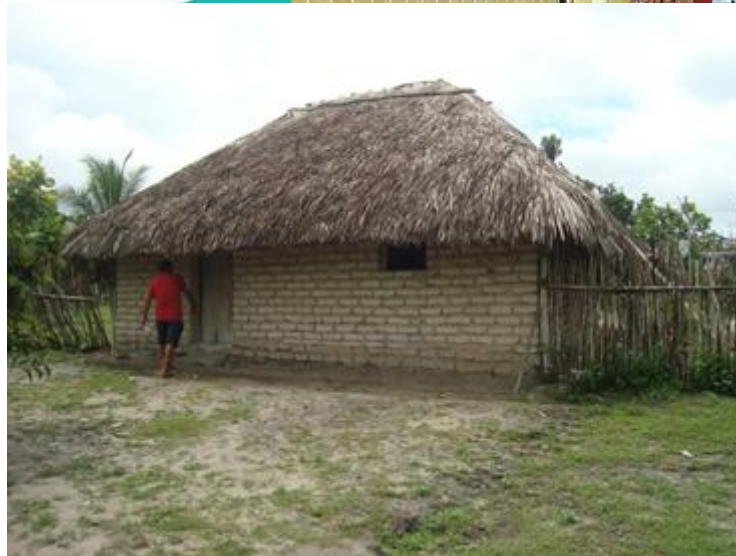
Figura 02: Moradia feita de tijolos de adobe, com cobertura em palha, no povoado de Pequizeiro.