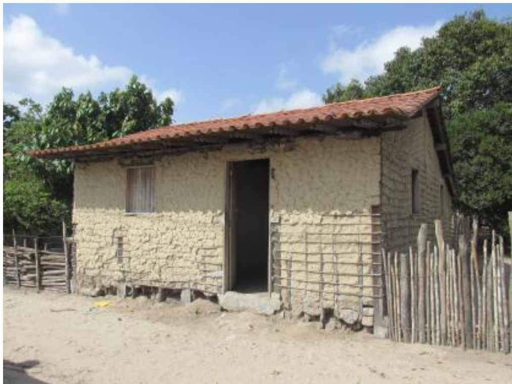
Figura 01: Moradia feita de taipa de mão não revestida, com cobertura em telha cerâmica, no povoado de São Miguel dos Correia.

No que se refere às moradias rurais vistas nestas regiões do Estado, percebeu-se claramente o que Costa e Mesquita (1978) discorrem sobre os habitantes deste meio imprimirem em suas habitações o seu padrão econômico e sua condição sociocultural, onde eles usam o material fornecido pela natureza e usam das técnicas que eles dominam. Os materiais empregados nas habitações rurais maranhenses estão diretamente ligados à abundância de vegetação e solo característicos de cada região. Dentre as técnicas construtivas tradicionais empregadas nas moradias rurais, têm-se o adobe, a taipa de mão e a madeira. Já nas coberturas têm-se principalmente a palha e a telha cerâmica.