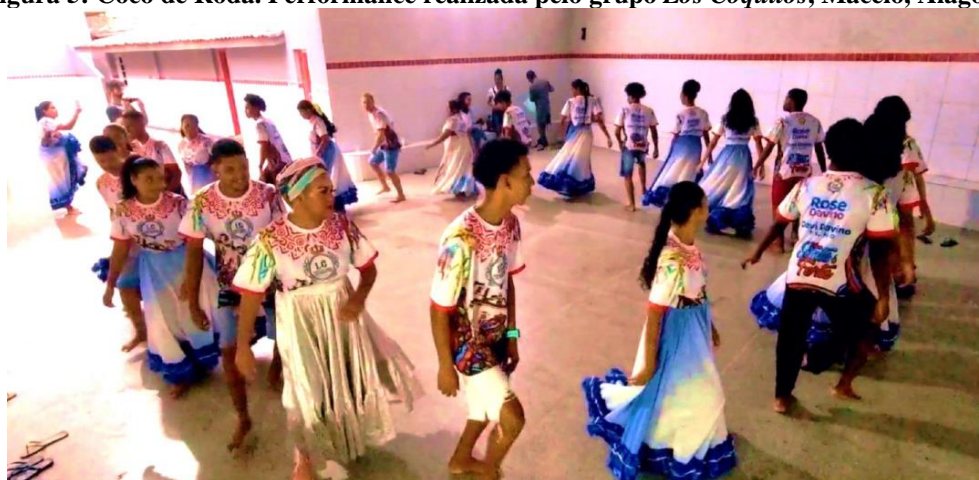
Figura 5: Coco de Roda. Performance realizada pelo grupo Los Coquitos , Maceió, Alagoas.

Fonte: Fotograma do Filme Coreisambo. Coco, reisado e Malambo . (FILOMOVE, UFAL, 2022) Dir. Natacha Muriel López Gallucci [Montagem em finalização]