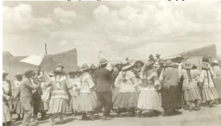
Figura 2 Carnaval de roda ou antigo [Fotografia tomada em Jujuy por Carlos Vega em 1932].

Fonte: Instituto Nacional de Musicología “Carlos Vega”. Nro. 34. Buenos Aires, Argentina: (SANCHEZ, 2018, p. 38)