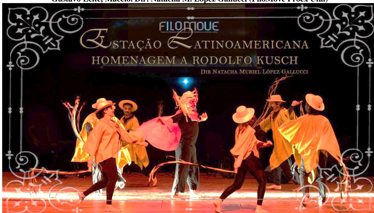
Figura 4 Carnavalito. Espetáculo. Estação Latinoamericana. Homenagem a Rodolfo Kusch. Teatro Gustavo Leite, Maceio. Dir. Natacha M. López Gallucci (FiloMove Proex Ufal)