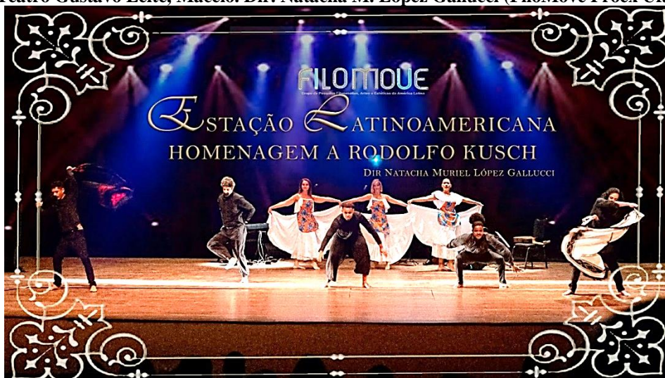
Figura 8. Chacarera. Espetáculo Estação Latinoamericana. Homenagem a Rodolfo Kusch. Teatro Gustavo Leite, Maceió. Dir. Natacha M. López Gallucci (FiloMove Proex Ufal)