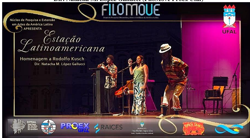
Figura 6. Cena de Coco alagoano. Grupo Verdinhos em Voz e Pandeiro e Italo Azuos em Dança. Espetáculo Estação Latinoamericana. Homenagem a Rodolfo Kusch. Teatro Deodoro. Dir. Natacha M. López Gallucci (FiloMove Proex Ufal)