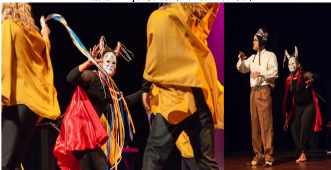
Fonte: Espetáculo Estação Latinoamericana. Homenagem a Rodolfo Kusch (2022-2023) Deodoro.