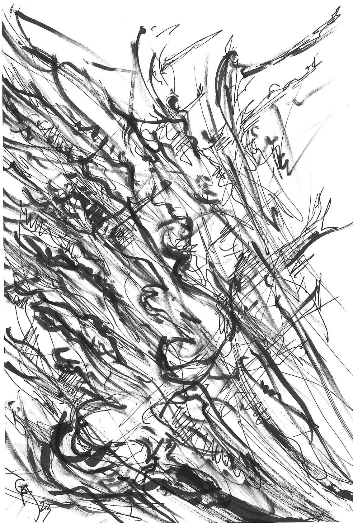
Imagem 6. Gazy Andraus, 2DImagem, Nanquim, formato A-5, Goiânia-GO, 2023.