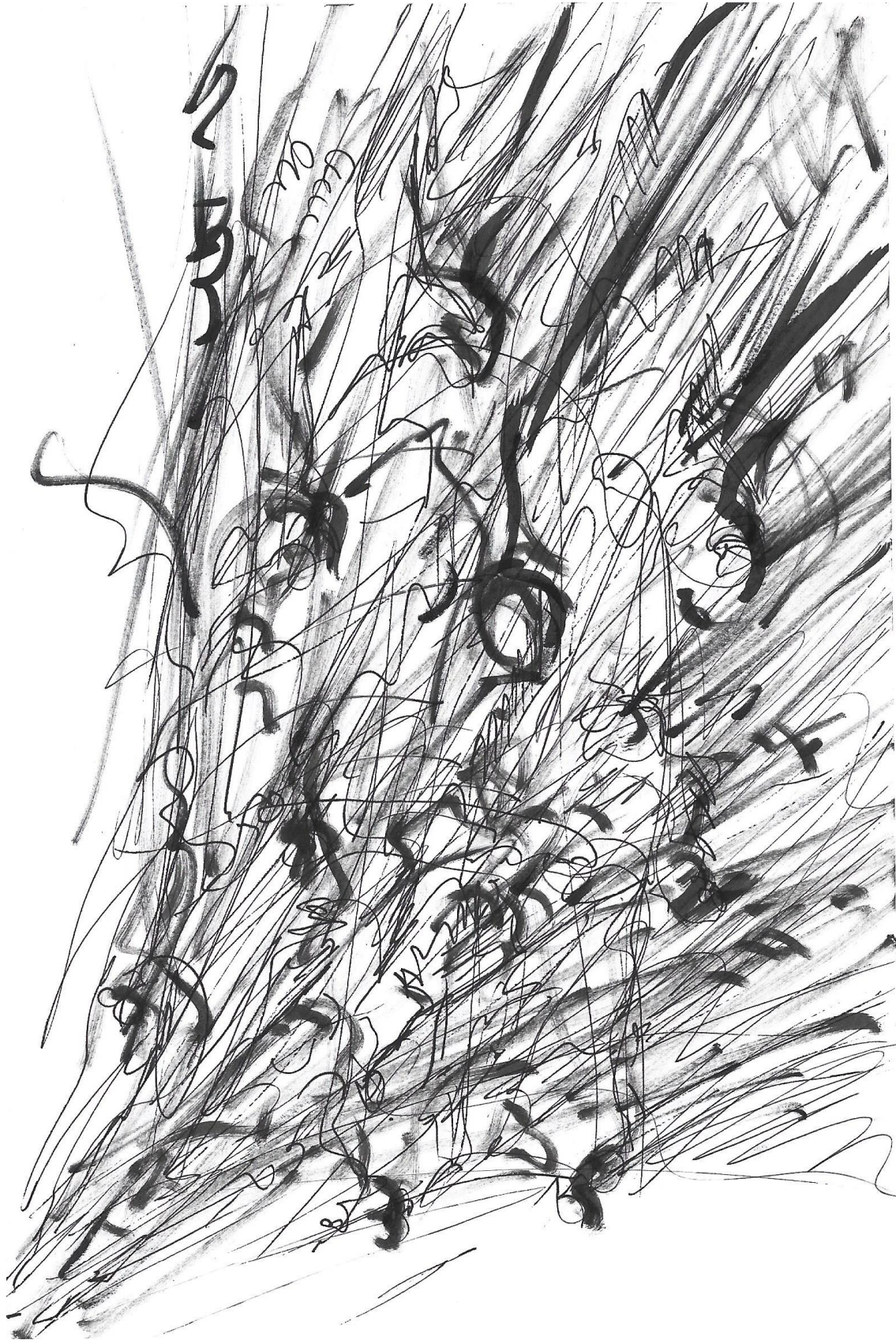
Imagem 7. Gazy Andraus, 2DImagem, Nanquim, formato A-5, Goiânia-GO, 2023.