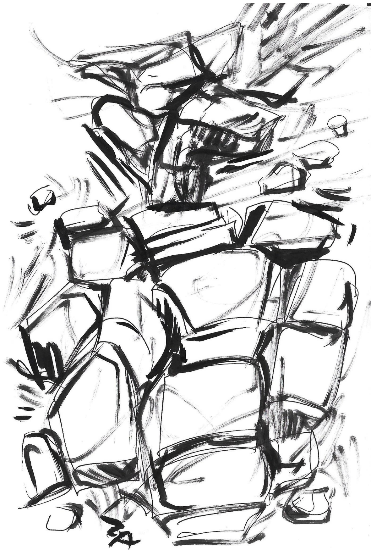
Imagem 2. Gazy Andraus, 2DImagem, Nanquim, formato A-5, Goiânia-GO, 2023.