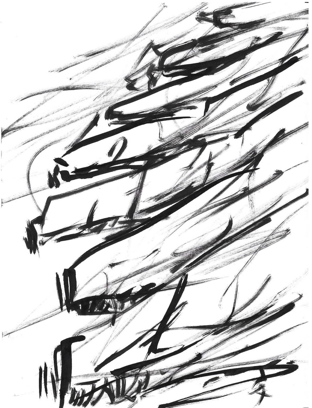
Imagem 8. Gazy Andraus, 2DImagem, Nanquim, formato A-5, Goiânia-GO, 2023. Foto: G. Andraus.