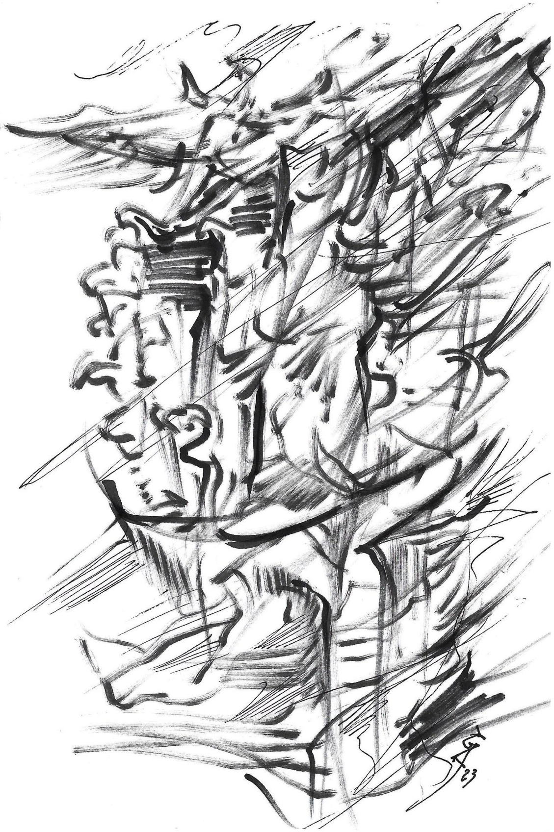
Imagem 4. Gazy Andraus, 2DImagem, Nanquim, formato A-5, Goiânia-GO, 2023.