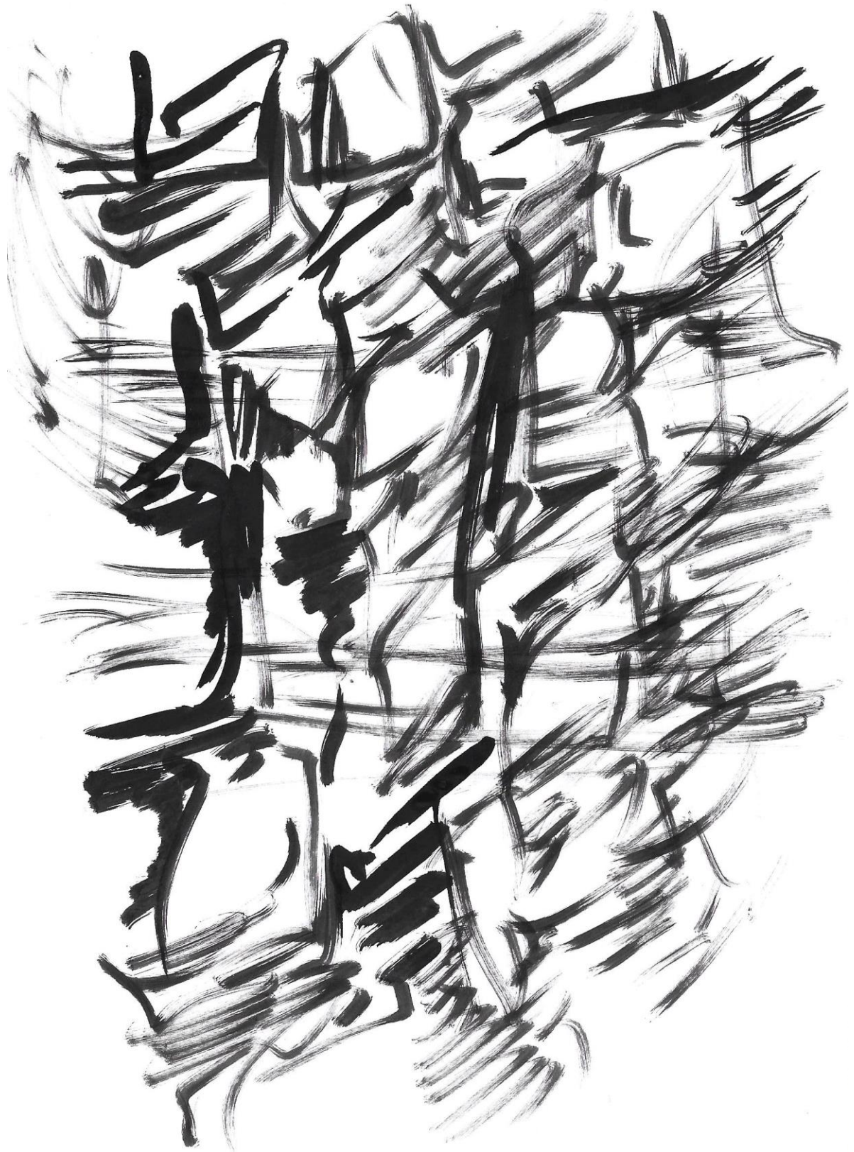
Imagem 3. Gazy Andraus, 2DImagem, Nanquim, formato A-5, Goiânia-GO, 2023.