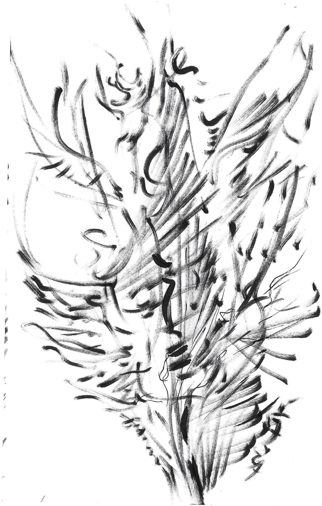
Imagem 5. Gazy Andraus, 2DImagem, Nanquim, formato A-5, Goiânia-GO, 2023.