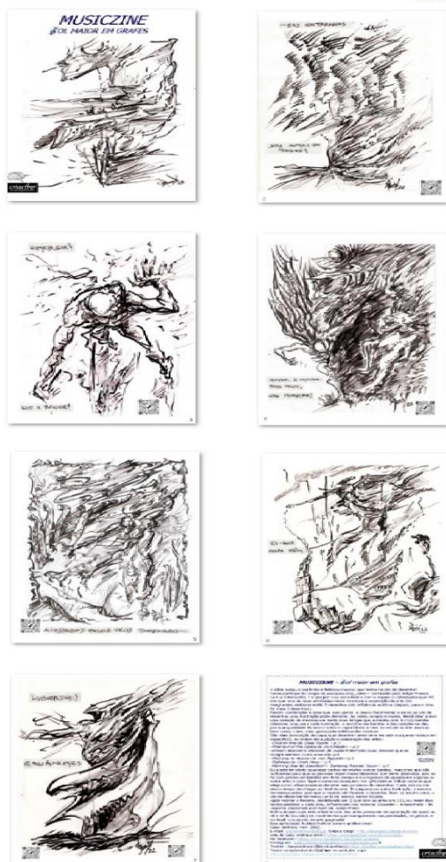
Imagem 3. Páginas do artzine “Sol maior em grafes”, 2022. Digital.

Esta ideia foi concebida a partir da influência musical que tem o autor no ato de desenhar, e que inclusive já foi demonstrada em um artigo e apresentada anteriormente num evento acadêmico, em 2009 ix .