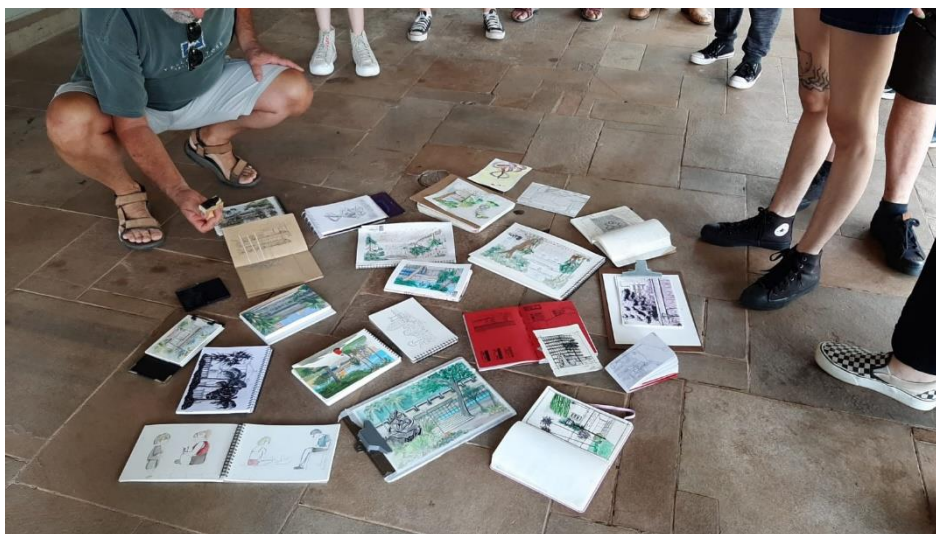
Imagem 8: Exposição dos desenhos realizados durante o 31º Encontro na Biblioteca Municipal de Campinas. Foto tirada em 15 de jan. de 2023.

Levando em consideração a breve introdução do movimento, objeto de estudo, bem como a sua relação com a pesquisadora, fica explícito que a pesquisa é de cunho etnográfico, pois versa sobre a construção de significados que as pessoas integrantes do movimento USk Campinas atribuem à prática do desenho de observação feito in loco , revelando modos de ser e estar no mundo. Por conseguinte, torna-se necessária a imersão da pesquisadora frente à comunidade investigada no período da realização da pesquisa de mestrado (fevereiro de 2023 a dezembro de 2024).