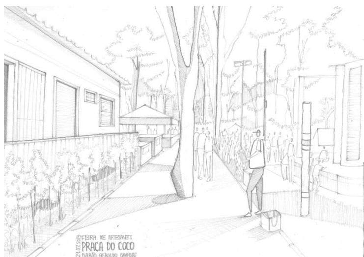
Imagem 4: Desenho de observação digitalizado, feito pela pesquisadora na Praça do Coco. Desenho realizado em jul. de 2023.