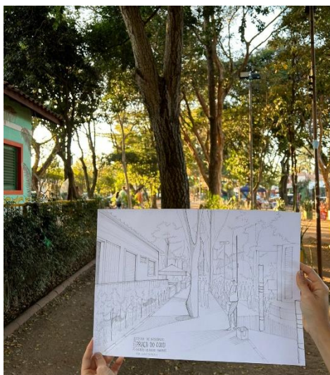
Imagem 3: Desenho de observação feito pela pesquisadora na Praça do Coco, localizada em Barão Geraldo, na cidade de Campinas. Foto tirada em jul. de 2023.

disciplinas ligadas à linguagem, arte e cultura, ministrou um curso introdutório de desenho arquitetônico e teve a oportunidade de conhecer membros e participar de encontros do USk Campinas, os quais participa até os dias atuais, uma vez surge a noção de pertencimento e acolhimento da comunidade em questão [ver imagens de 3 a 8]. Por esse motivo, entender seu funcionamento compreende entender onde a pesquisadora se situa na pesquisa, compreender como sua subjetividade emerge em seus desenhos e de que maneira ela expressa uma espacialidade da cidade de Campinas.