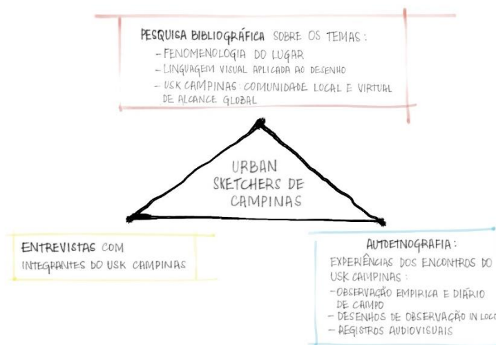
Imagem 9: Diagrama metodológico da pesquisa. Desenho digital elaborado pela autora com o auxílio da ferramenta Krita .

A partir disso, a metodologia híbrida adota a triangulação de dados entre a pesquisa bibliográfica, a realização de entrevistas com os integrantes do USk Campinas e a pesquisa autoetnográfica, conforme mostra o diagrama abaixo: