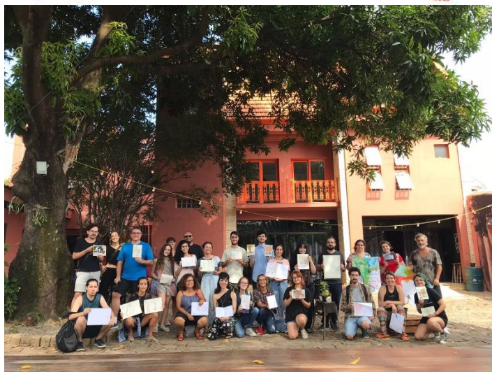
Imagem 7: Integrantes do USk Campinas com seus respectivos desenhos realizados durante o 35º Encontro no Coletivo Mangureira, centro cultural localizado no bairro Jd. Sta. Genebra. Foto tirada em 7 de mai. de 2023.