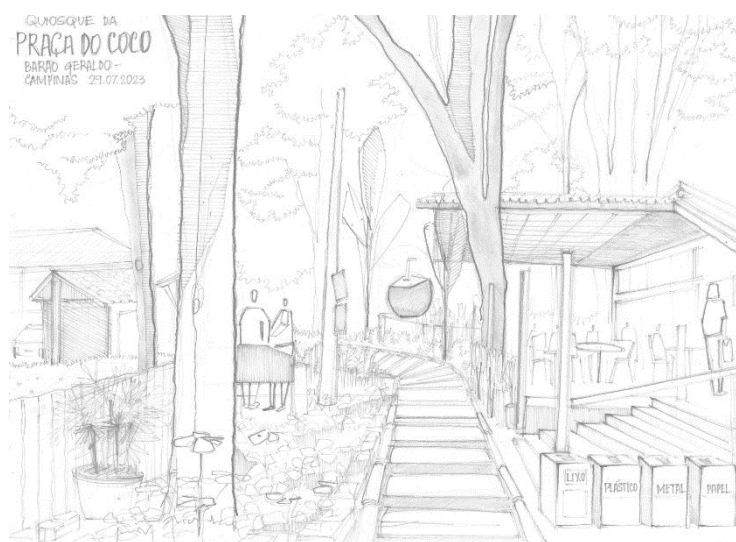
Imagem 6: Desenho de observação digitalizado, feito pela pesquisadora na Praça do Coco. Desenho realizado em jul. de 2023.