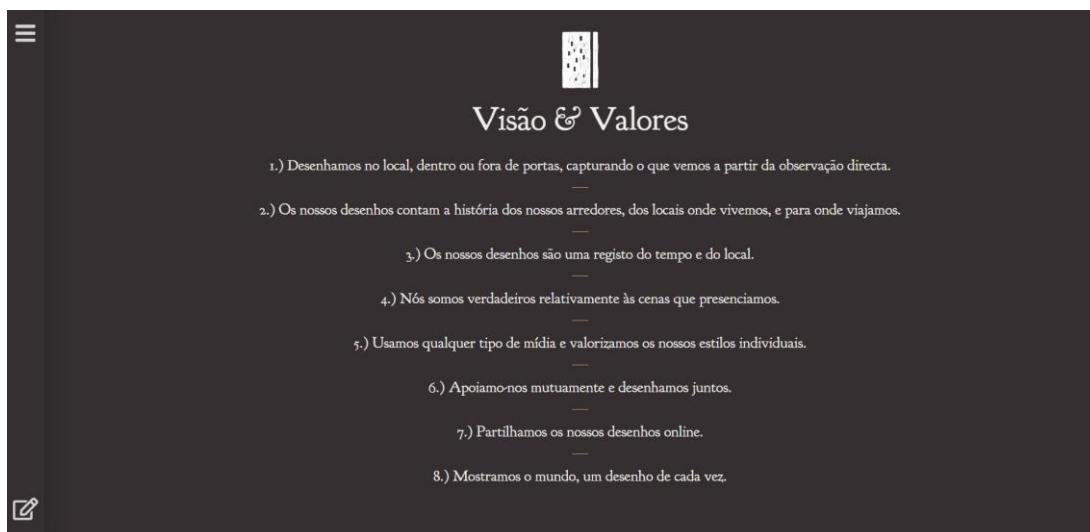
Imagem 1: Print Screen do Manifesto Urban Sketchers , publicado no site oficial da comunidade. Tradução para o português oferecida pelo site oficial. Captura de tela disponível em: < https://urbansketchers.org/pt/who-we-are/ >. Acesso em: 24 de ago. de 2023.

Os valores compartilhados pelos desenhistas urbanos, também chamados de sketchers, ao redor do mundo, encontram-se organizados em um manifesto: