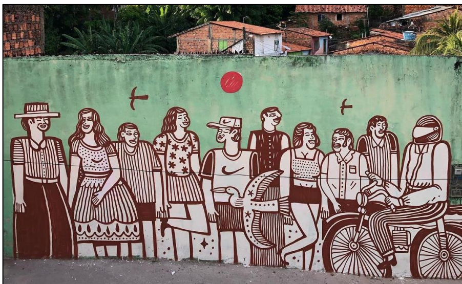
Imagem 1: Grafite no bairro da Vila Embratel. 21/12/2020.

ressignificação urbana de espaços que recebem o título de marginalizados. Apresento como exemplo o grafite do grupo Cores da Vila, presentes no bairro da Vila Embratel, e o grafite produto de uma ação de conscientização sobre o direito da pessoa com deficiência, organizado pela instituição Colégio São José Operário, no bairro da Cidade Operária.