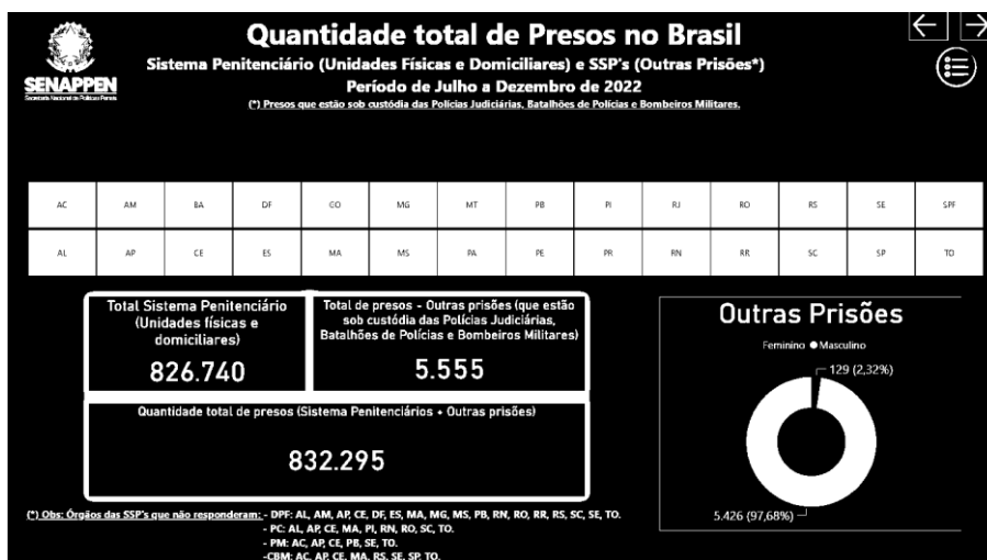
Figura 1: Quantidade total de presos no Brasil em 2022

dados estatísticos do sistema prisional divulgados pela Secretaria Nacional de Políticas Penais (SENAPPEN, 2022)