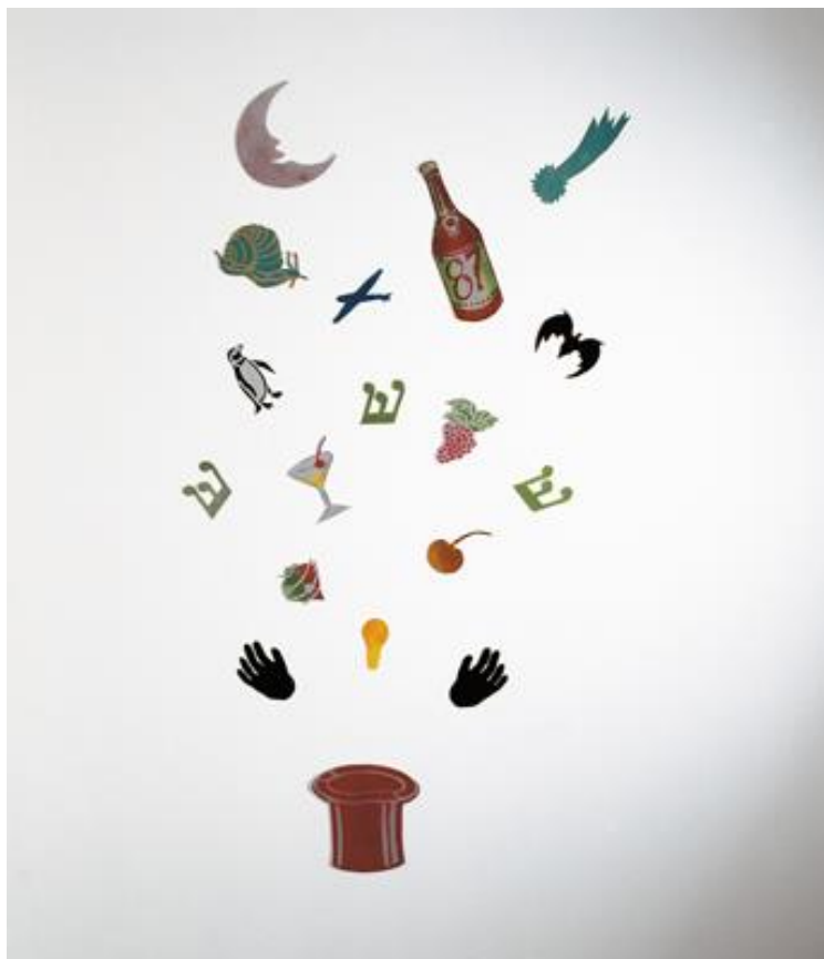
Imagem 2. Alex Vallauri, O Mágico , Spray sobre pvc, 200,00 cm x 110,00 cm, Coleção Museu de Arte Moderna de São Paulo - Doação Suzanna Sassoun.

várias figuras em PVC, pintadas com tinta spray, que parecem emergir de uma cartola, atualmente no acervo do Museu de Arte Moderna de São Paulo (MAM-SP).