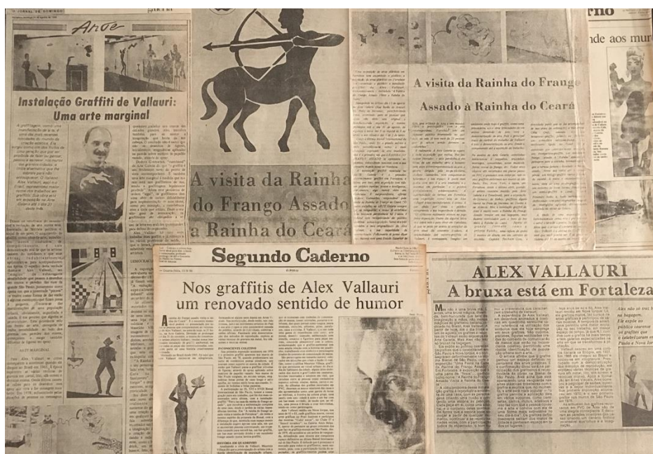
Imagem 4. Reprodução de matérias publicadas por jornais de Fortaleza

A chegada da versão da instalação-grafite A festa na casa da Rainha do Frango Assado à Arte Galeria, em 13 de agosto de 1986, foi exaltada pela mídia, que viu no evento uma oportunidade de atualização (Imagem 4). “O surgimento do graffiti como obra-de-arte, imbuído em novos costumes de comportamento, é uma demonstração real de que os artistas nascem do cotidiano e que suas obras, indubitavelmente, aprimoram-se para acompanharem sua época” (sic), escreveu o semanário Fort News (1986, n.p). Outros aspectos da mostra foram destacados: “(...) com a participação lúdica do espectador, os graffitis-recortes podem criar inúmeras situações, dando a cada associação um renovado sentido de humor – característica contagiante do trabalho de Alex Vallauri” (sic), publicou o jornal O Povo (1986, p. 2-1) em reportagem na capa do Segundo Caderno , dedicado aos assuntos artísticos e culturais.