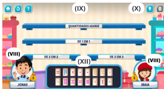
Figura 2 - Referência de potencialidades observadas no RED Chocomática Inauguração.

Observando a perspectiva que temos das representações que são encontradas no primeiro recurso que não estão presentes na proposta do segundo, sendo estas a (I), (IV) e (VI), essa diferenciação evidencia que suas propostas são diversificadas e complementares. Na figura 2, temos um panorama de como é a interface do RED Chocomática Inauguração e as múltiplas representações que apresenta.