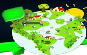
Figura 01: Tipos de circuitos curtos de comercialização de alimentos orgânicos e agroecológicos, segundo a tipologia apresentada por Darolt e Rover (2021).