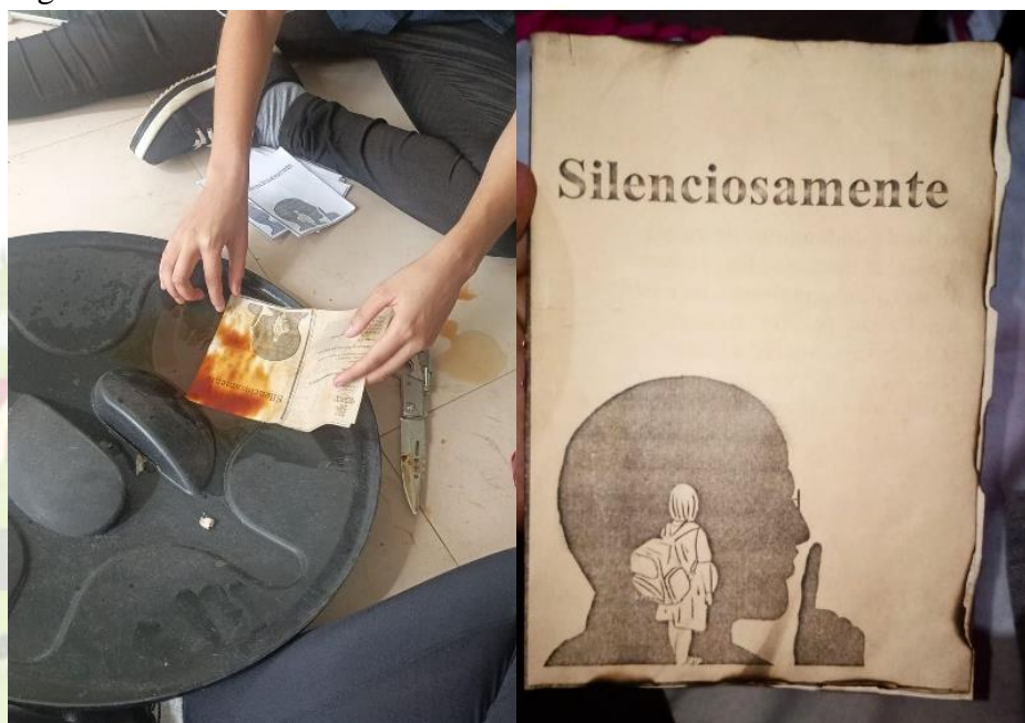
Figura 2: Técnica de envelhecimento do livreto

As capas dos cordéis foram produzidas a partir de diversas técnicas (desenho à mão, aplicativos editores de imagens, e seleção de imagens na internet). Os cordéis foram formatados para impressão como livreto, impressos, montados e grampeados. Parte dos cordéis foi customizada pelos alunos, utilizando a técnica de envelhecimento com café e queima das bordas (Figura 2).