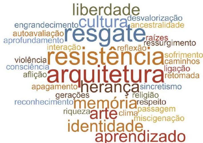
Figura 1: Nuvem de palavras-chave apresentadas pelos estudantes no processo criativo

A experiência partiu do interesse e da incontornável necessidade da inserção da temática étnico-racial e da discussão sobre a contribuição da arquitetura também no projeto de arquitetura. A apresentação do tema trouxe a indicação de autoras e autores negros, africanos e latino-americanos tanto nas leituras quanto como nos casos de memoriais estudados como referência. Foi importante notar a aptidão dos alunos para participar das conversas, oriundos que são de uma educação básica que já vem tratando da questão. A partir de discussões sobre lugares de memória, identidade e o direito à cidade, os alunos preparavam inicialmente uma colagem com imagens de referência e palavras-chave que representassem o entendimento sobre o tema e o início de uma síntese dos conceitos que embasariam o projeto. Nesse momento, a frequente recorrência a palavras como dor, sofrimento e esquecimento era aproveitada como oportunidade para se discutir se o que o projeto representaria o negro nessas posições ou se seria oportuno trazer para o projeto aspectos da sua contribuição para a construção da cultura brasileira a partir dos seus saberes e potencialidades, dos quais se sabe pouco ainda hoje. Assim, o debate levava à inclusão de palavras-chave mais positivas, otimistas e que buscavam enaltecer a cultura africana e afro-brasileira (Figura 1).