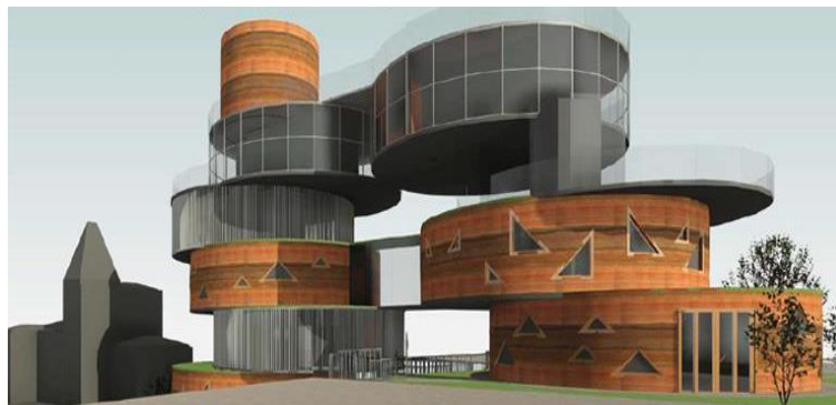
Figura 3: Projeto dos estudantes