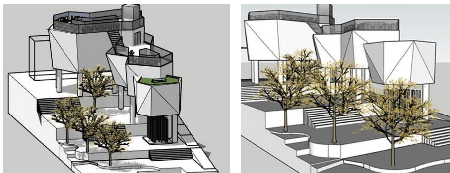
Figuras 3 e 4: Projeto dos estudantes