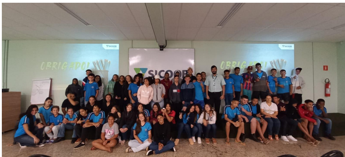
Foto 3 – Workshop realizado pela Unidade de Educação e Desenvolvimento do Cooperativismo do Sicoob Sarom para estudantes da E. E. General Carneiro