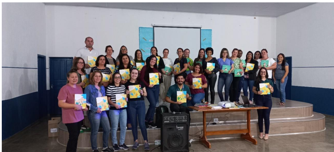
Foto 1 – Entrega do material pedagógico do Novo Cooperjovem para educadores capacitados pela Unidade de Educação e Desenvolvimento do Cooperativismo do Sicoob Sarom.