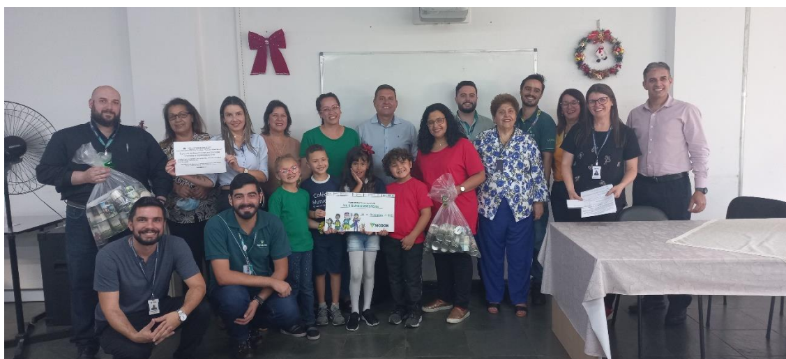
Foto 4 – Entrega da premiação do edital de empreendedorismo pelo Sicoob Sarom no município de Poços de Caldas