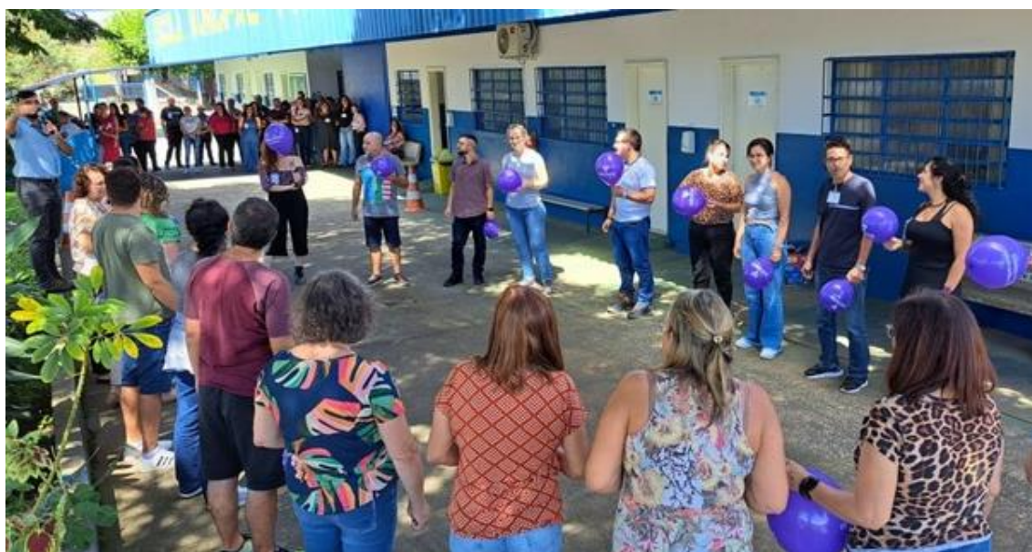
Foto 6 – Dinâmica de grupo realizada em capacitação presencial de professores para implementação das ações do Movimento CoopEducação nas escolas onde atuam