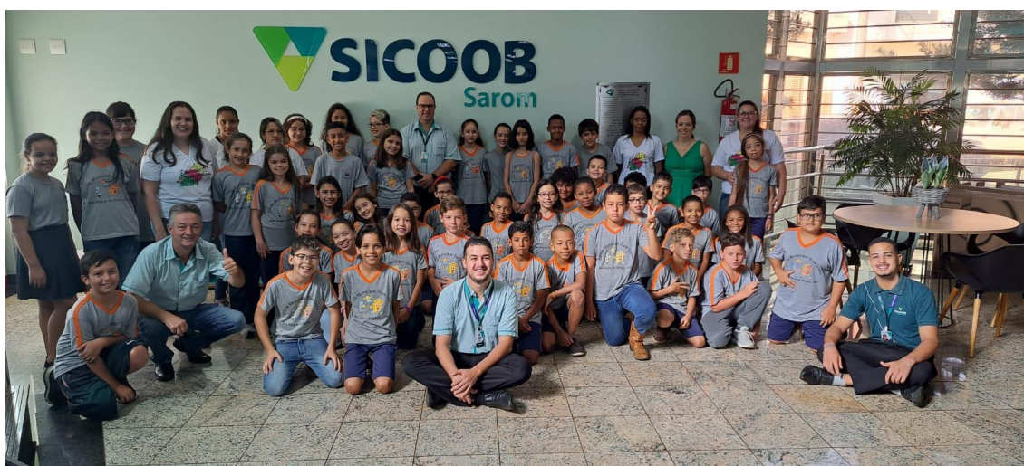
Foto 2 – Visita dos estudantes da E. M. Guia Lopes às instalações do Sicoob Sarom