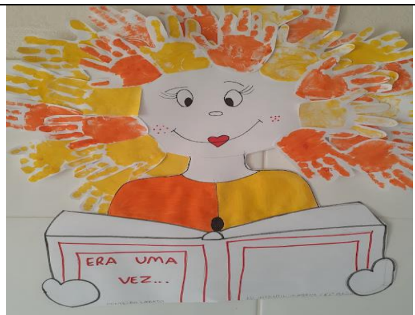
Figura 03 – Sala de contação de Histórias