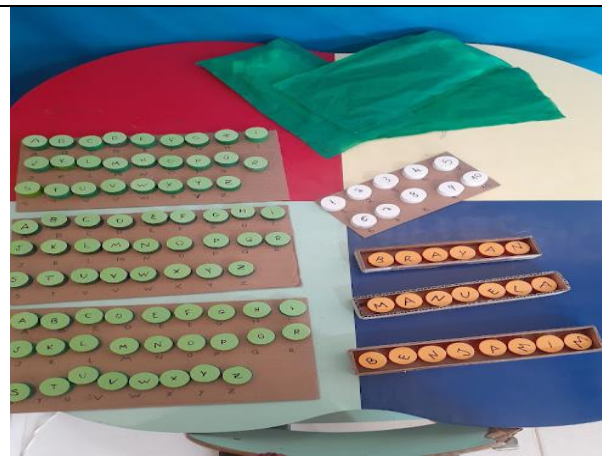
Figura 02 – Jogo Alfabeto Lúdico