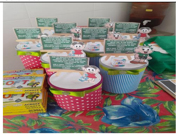
Figura 04 – Cantinho da arte – Cofres Coloridos