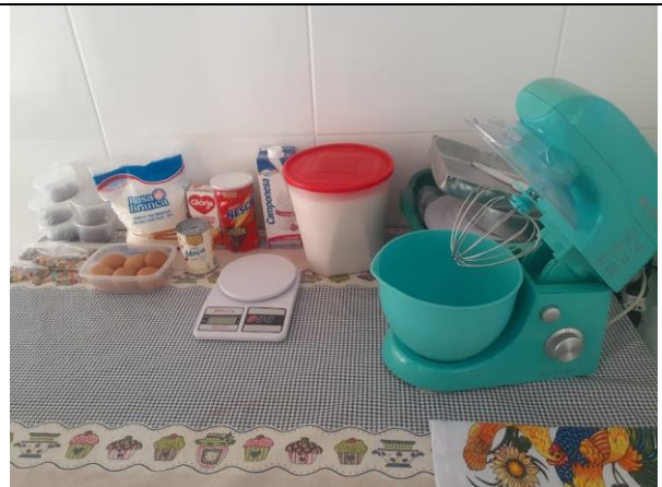
Figura 05 – Aula prática – Colocando a mão na massa