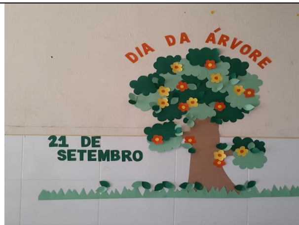
Figura 01 – Painel Comemoração do dia da árvore