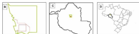
Figura 1. Localização da Flona do Jamari, RO. UMF-III e UPA1 - 1.586,78 hectares.