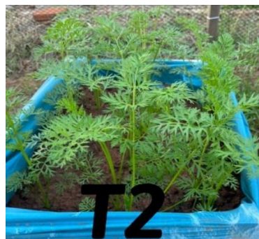
Figura 2: Desenvolvimento de Daucus carota , tratamento 2: 7g dm -3 de cinza.