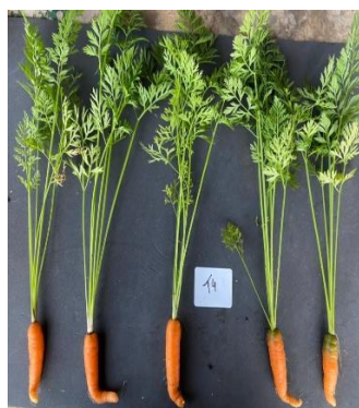
Figura 10: Desenvolvimento da raiz de Daucus carota após 110 dias do tratamento 4: 21g dm -3 de cinza.