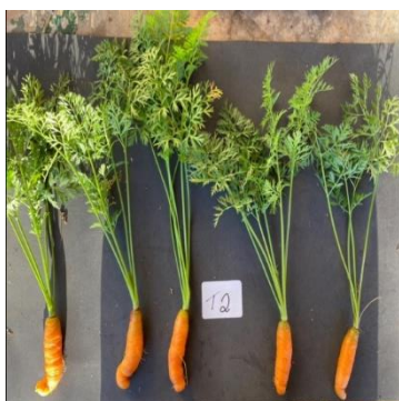
Figura 8: Desenvolvimento da raiz de Daucus carota após 110 dias do tratamento 2: 7g dm -3 de cinza.