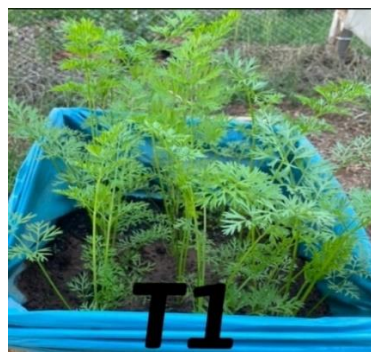
Figura 1: Desenvolvimento de Daucus carota , tratamento 1: testemunha sem cinza.

Foi utilizado na primeira semeadura a cultivar Brasília da Embrapa, que possui maior adaptabilidade no estado para cultivo de outubro a março, devido o segundo plantio ser em outra época se utilizou a cultivar Nantes, sendo a base da apuração de dados, esta que possui adaptabilidade no estado para cultivo de abril a agosto, suas raízes podem chegar a 22cm com diâmetro de até 4cm. Então semeadas diretamente no recipiente já preparado com as cinzas e proporção de solo, em profundidade de 1cm.