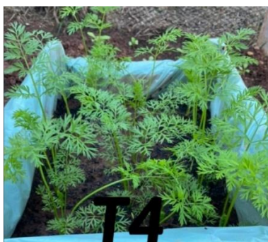
Figura 4: Desenvolvimento de Daucus carota , tratamento 4: 21\text{g dm}^{-3} de cinza.