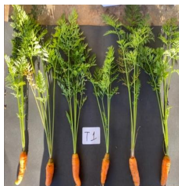
Figura 7: Desenvolvimento da raiz de Daucus carota após 110 dias do tratamento 1: testemunha sem cinza.

A cultivar Nantes, esta que utilizada neste experimento possui aspectos fenotípicos como raiz com comprimento de 18-22cm e diâmetro de 2-4 cm, o experimento de melhor resultado mostrou raízes com média de 14 cm de comprimento e diâmetro de 2,48 cm (tabela 4), levando em consideração que a nutrição tem grande efetivo sobre aspectos qualitativos das raízes e em consequência em sua produtividade, havendo uma junção entre aplicação das cinzas vegetais com outra adubação orgânica que possa conter maiores teores de nitrogênio poderia repor essa falta que a cinza não apresenta, podendo chegar a produtividade ideal da cultivar, extraindo até seu máximo potencial produtivo.