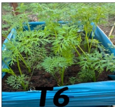
Figura 6: Desenvolvimento de Daucus carota , tratamento 6: 35\text{g dm}^{-3} de cinza.

Assim a colheita do experimento foi realizada 110 D.A.S, onde as raízes foram lavadas e separadas da parte aérea, para a avaliação das variáveis agrônômicas: fitomassa fresca raiz (FFR); fitomassa fresca parte aérea (FFPA), estas que foram pesadas em balança semi-analítica, após acondicionada em saco de papel devidamente etiquetada, sendo levada a estufa de circulação de ar forçada em temperatura controlada de 65^{\circ}\text{C} até atingir massa constante por um período de três dias, para então novamente pesadas e obtidas variáveis fitomassa seca raiz (FSR); fitomassa seca parte aérea (FSPA), o diâmetro da raiz (DR) aqui mensurada por paquímetro graduada, apresentada em centímetros.