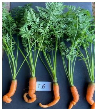
Figura 12: Desenvolvimento da raiz de Daucus carota após 110 dias do tratamento 6.