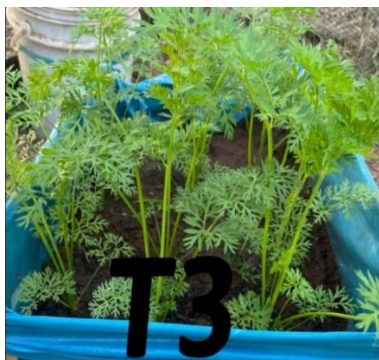
Figura 3: Desenvolvimento de Daucus carota , tratamento 3: 14\text{g dm}^{-3} de cinza.