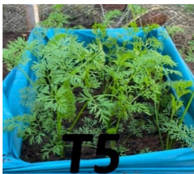
Figura 5: Desenvolvimento de Daucus carota , tratamento 5: 28\text{g dm}^{-3} de cinza.