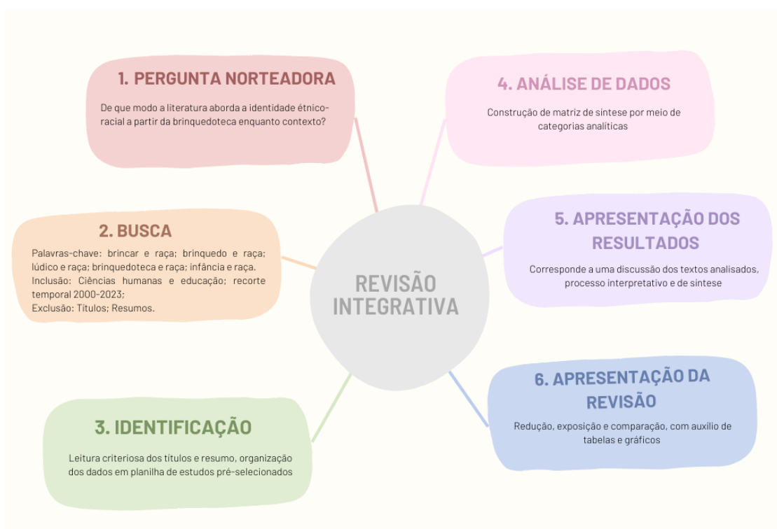
Figura 1 – Revisão Integrativa conforme Souza, Silva e Carvalho (2010)

A começar pela metodologia utilizada, o estudo consistiu em uma revisão integrativa da literatura baseada na proposta de Souza, Silva e Carvalho (2010), exposta na Figura 1. A primeira etapa consistiu na definição da seguinte pergunta norteadora: De que modo a literatura aborda a identidade étnico-racial a partir da brinquedoteca enquanto contexto? em seguida, foi realizada a busca de artigos publicados nas bases de dados Scielo, Pepsic, Eric e Scopus. A coleta de dados ocorreu por meio da combinação de palavras-chave: brincar e raça; brinquedo e raça; lúdico e raça; brinquedoteca e raça; infância e raça.