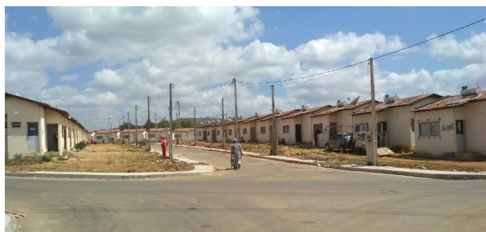
Figura 4. Obras Retomadas

Constata-se também que o setor 2 do Residencial Brivaldo Medeiros e o Residencial Antônio Ribeiro foram totalmente desocupados, o que facilitou o trabalho da Construtora, que conseguiu dar continuidade nas obras sem interferência nem impedimentos causados pelos ocupantes, como é possível observar na figura 4: