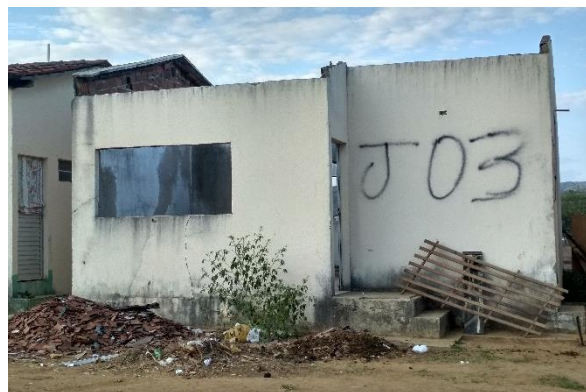
Figura 2. Unidade Habitacional Sem os Materiais Que Foram Furtados

Ao decorrer da fase construtiva dos empreendimentos, a construtora começou a passar por problemas de cunho financeiro e administrativo, fazendo com que as obras fossem paralisadas, motivo pelo qual a construtora pediu a recuperação judicial, no dia 8 de janeiro de 2014, deixando o local abandonado. Essa ausência de funcionários e seguranças nos residenciais em construção fez com que começasse a haver furtos dos materiais e equipamentos já instalados nas residências. De acordo com as informações passadas pelo serviço 190, da Polícia Militar em Palmeira dos Índios-AL, ocorreram várias denúncias que pessoas desconhecidas estavam levando materiais das residências, o que pode ser constatado na figura 2.