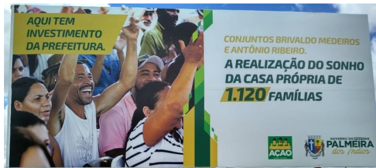
Figura 1. Placa com a Quantidade de Famílias Beneficiadas