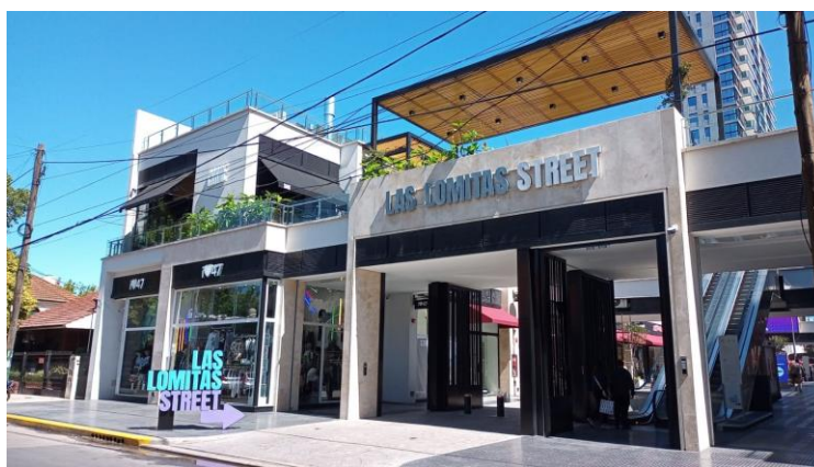
Imagen 3: fachada del emprendimiento Las Lomitas street and residence

Presentemos, brevemente, un caso que da cuenta de esta mercantilización del centro: la reciente inauguración de Las Lomitas Street and residence (2022).