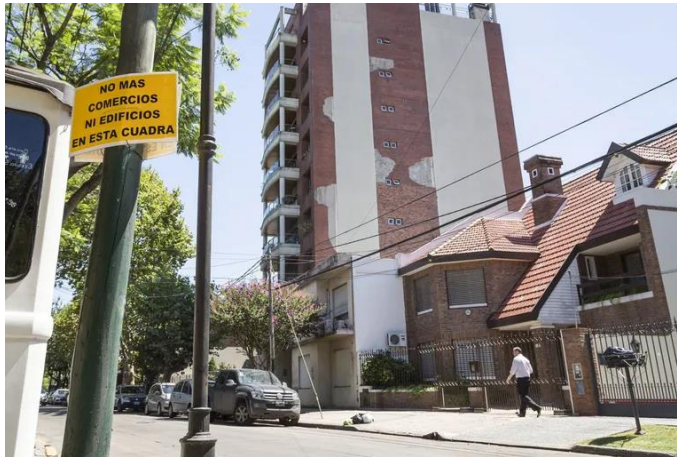
Imagen 2: Casas y edificios de departamentos en Las Lomitas Fuente: Diego Spivacow. Publicada en Diario La Nación el día 27 de febrero de 2018.

Es decir, eran (y son) terrenos grandes y su metraje posibilitaba la construcción de edificios de departamentos, a pesar de las recurrentes quejas y denuncias de los vecinos, fundamentalmente organizados bajo la Asociación Vecinal Fuenteovejuna, por el avasallamiento del barrio y sus formas de habitar.