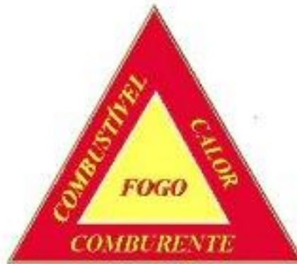
Figura 1 – Triângulo do Fogo