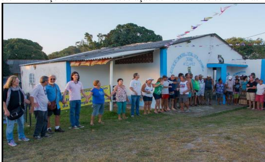
Foto 1 - Abraço coletivo na Associação de Pescadores de Zacarias