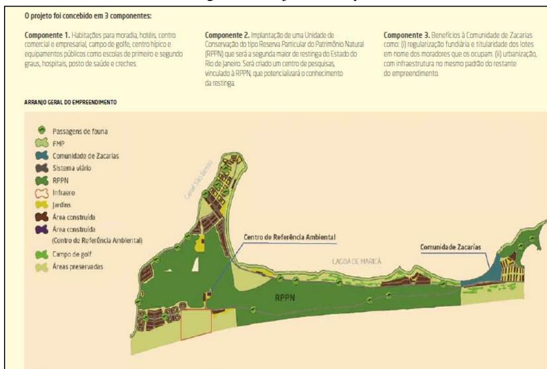
Figura 5 - Projeto Maraey