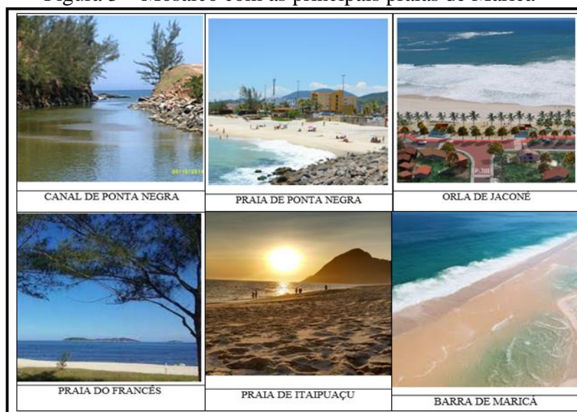
Figura 3 – Mosaico com as principais praias de Maricá

Fonte: Fotos PMM/STM, (2011). Mosaico organizado pelo Autor.