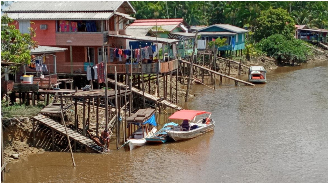
Figura 3: Moradias em palafita no Bairro do Elesbão.

O céu, quando não chove, é azul e permeado pelo verde da floresta que faz parte do lugar. Que contribui para diminuir o calor em excesso, já que a temperatura comum é 36 graus, cotidianamente. Esse calor todo intensifica as chuvas locais, que comunicam recados a quem sabe ouvir, uma vez que a água tangencia o cotidiano dos moradores do Elesbão em diversos aspectos. Pelo rio, alguns moradores atravessam o Amazonas para algumas das ilhas na margem do outro lado para garantir o alimento do dia a dia, seja o camarão ou o açaí; alimentos indispensáveis na dieta local.