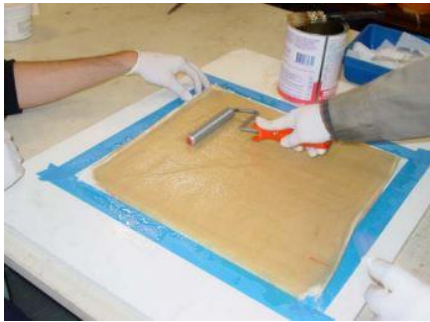
Figura 4. Preparação do compósito por moldagem manual (Raftoyiannis, 2012).

e comumente percebido em compósitos de fibras vegetais.