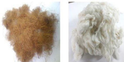
Figura 3. Coco tratado (esquerda) e algodão tratado (direita) (Balaji et al., 2017).

Balaji e colaboradores (2017) conduziram ensaios de tração, flexão e impacto nas fibras de algodão e coco como reforços para a resina poliéster insaturada. As amostras foram separadas quanto ao teor de fibra, em que houve amostras híbridas (contendo algodão e coco), reforçadas apenas com algodão e reforçadas apenas com coco. Por meio dos experimentos foi constatado que os compósitos com maiores quantidades de fibra de algodão apresentavam melhores propriedades mecânicas. Com isso, foi possível concluir que o algodão é uma fibra de reforço mais resistente que a fibra de coco para matriz em resina poliéster, fato atribuído à uma adesão maior do algodão para essa resina.