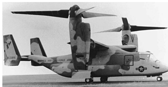
Figura 2. The BELL™ V-22 Osprey em configuração de combate (Kaw, 2005).

Atualmente, é imenso o leque de opções de compósitos reforçados por fibras no mercado e suas aplicações. No geral, é feita a divisão entre reforços de fibras sintéticas e fibras naturais. Um exemplo de aplicação é ilustrado na Figura 2, que se trata de um helicóptero com as pás do rotor fabricadas em matriz epóxi reforçada com fibras sintéticas de vidro e grafite.