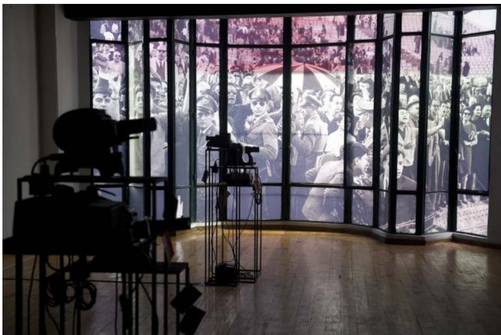
Imagem 1. Instalação Río-Montevideo (2016). Centro de Fotografia de Montevideo, Uruguai.

A nova sede do CdF foi o local designado para a exposição. Um prédio histórico, estilo art decó, localizado na principal avenida de Montevideu, no centro da cidade. Construído entre 1931 e 1932, o Edifício Bazar foi planejado para servir ao comércio, o que explica a grande vidraça na fachada e os amplos salões abertos. As características comerciais do prédio também inspiraram Rosângela Rennó, que se baseou no nome de uma antiga e tradicional loja que existia na mesma avenida; London Paris , fundada em 1908 e fechada oficialmente em 1966 (CORDEIRO, 2015, p.197).