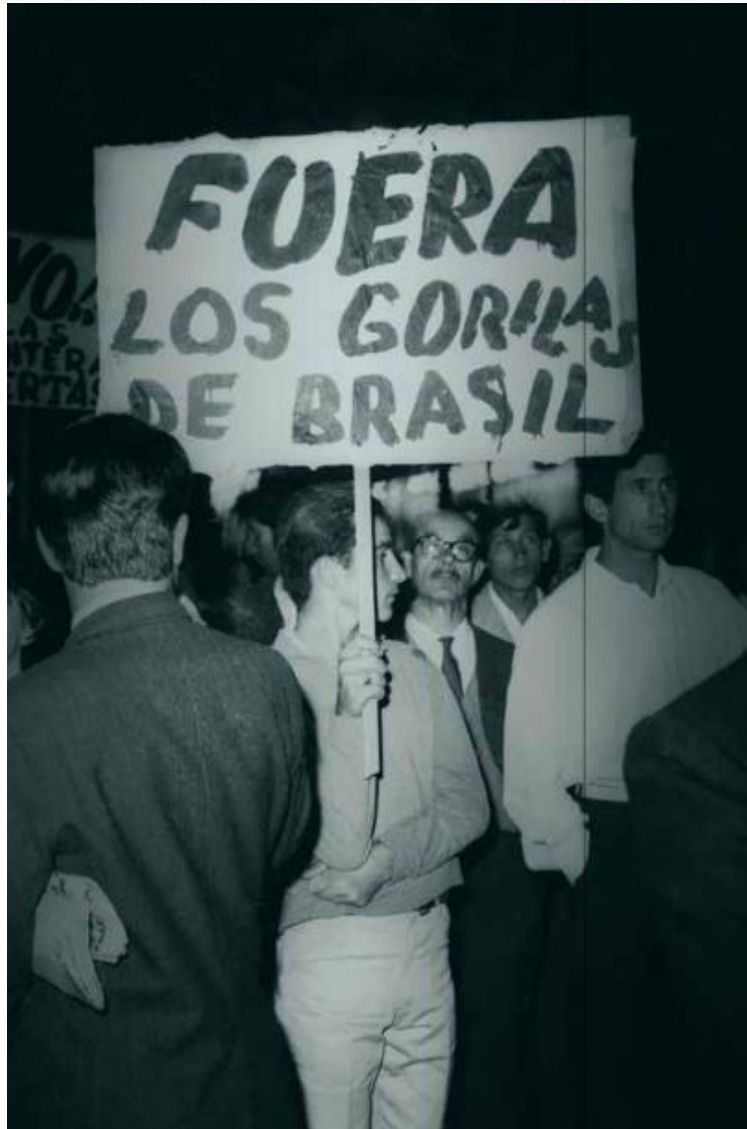
Imagem 3: Fotografia recuperada do arquivo do jornal El Popular .

Fonte: Livro “Río-Montevideo”, página 50. CdF, 2011.