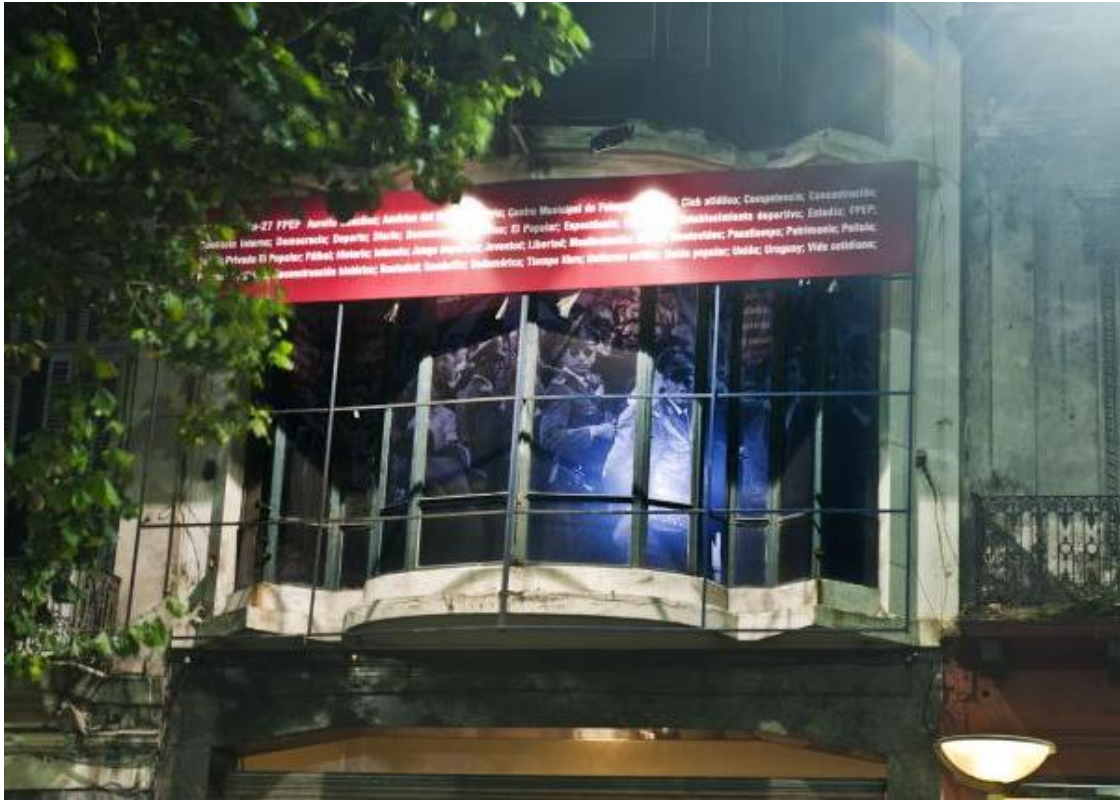
Imagem 5: Fotografia da fachada do Cdf durante a exposição Ríó-Montevideo

o som, esvaziado de seu discurso, censurado, como as imagens e os personagens iluminados naquela sala escura.