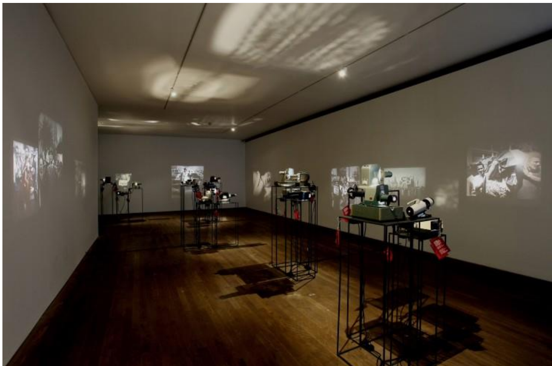
Imagem 2: Instalação Río-Montevideo , (2016). Centro de Fotografia de Montevideo, Uruguai.

As fotografias, projetadas nas paredes e em espelhos, criavam imagens fantasmagóricas que se sobrepunham e, às vezes, se desvaneciam graças ao desfoque causado pelos equipamentos antigos, como vemos na imagem 2. Ao entrar na sala, o visitante se deparava com uma variedade de imagens projetadas e era convidado a interagir com as projeções operando manualmente cada equipamento. Com a interação, há uma mudança constante na sequência da exibição oferecendo sempre uma visão diferente dos eventos que as fotografias apresentavam (CORDEIRO, 2015, p.198).