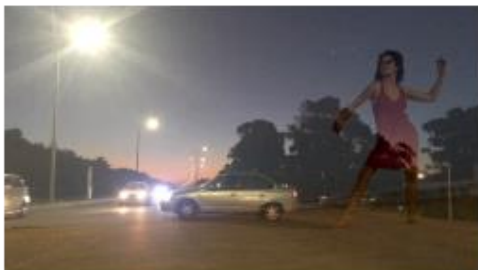
Fig. 1 - Registro pessoal