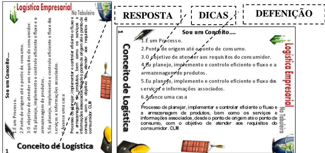
Figura 4 – Imagem das cartas do jogo

para a realização das etapas do jogo, definiu-se que a carta deveria conter poucos itens para descrever os conceitos a serem ensinados a fim de torná-lo um jogo didático simples.