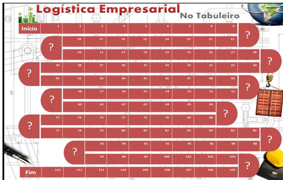
Figura 3 – Ilustração do Tabuleiro do jogo

O jogo ambienta-se em etapas (passo a passo), sendo o tabuleiro inspirado em um jogo de dados. O tabuleiro possui 115 posições que representam as casas em que o jogador irá movimentar o pino (equipe), com dimensão de 42 x 29,7 centímetros, sendo um plano cartesiano. Os jogadores inicialmente devem colocar os pinos na casa início, conforme a dinâmica dos dados (Soma), ocorre a evolução do jogador no jogo, o tabuleiro apresenta 11 caixas com o símbolo de ? , à equipe irá realizar um case de verdadeiro ou falso. A figura 3 apresenta o tabuleiro do jogo.