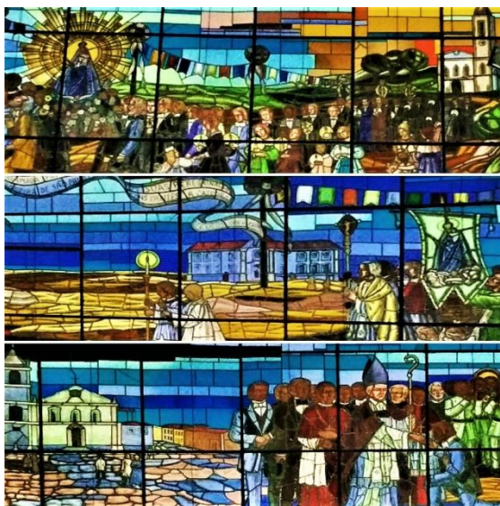
Figura 2. Painel-vitral no adro da Basílica da Penha retratando as transladações que culminaram com a aclamação da Virgem da Penha como Padroeira da cidade de São Paulo. (Nesta foto, recortes e montagem com as três partes do painel-vitral, possibilitando melhor observação dos detalhes das cenas retratadas), Basílica de Nossa Senhora da Penha – São Paulo – SP, 2018.

aos séculos XVII e XVIII, e não aos XVIII e XIX, em consonância com o que apresentamos anteriormente: “NOSSA SENHORA DA PENHA ACLAMADA POPULARMENTE PADROEIRA DE SÃO PAULO EM SUAS PEREGRINAÇÕES CONSTANTES A CATEDRAL SÉCULOS XVII E XVIII”.