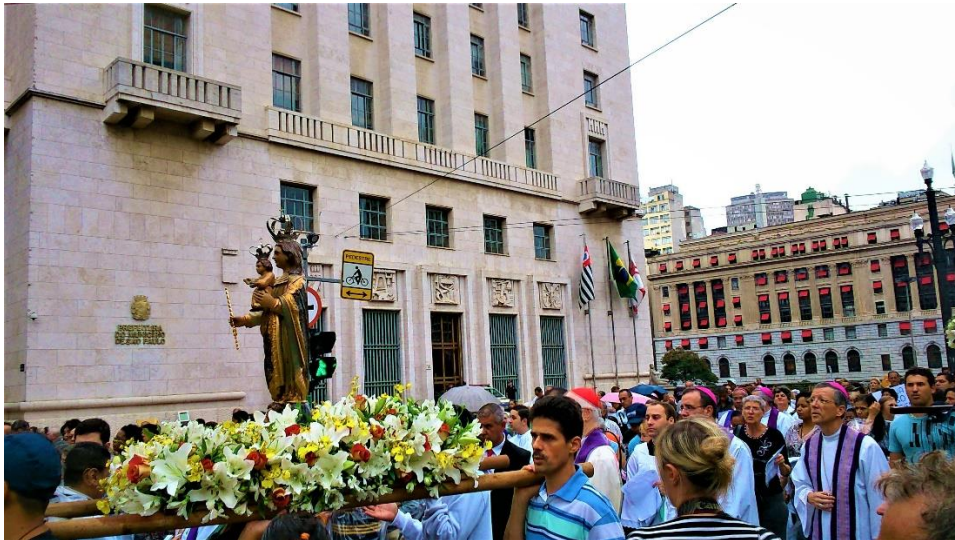
Figura 3. Transladação da imagem de Nossa Senhora da Penha para pedir a chuva em 22/3/2015. A imagem foi trazida em cortejo de motoqueiros da Penha de França até a Igreja da Consolação. De lá, foi levada em procissão pelo Centro Histórico de São Paulo (conforme se observa na foto) até a Catedral da Sé. Durante a passagem do cortejo, registrou-se chuva na região central da cidade.