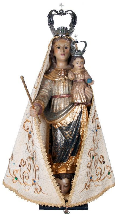
Figura 1. Nossa Senhora da Penha de França. Século XVII. Autor e procedência desconhecidos. Madeira dourada e policromada, tecido. Basílica de Nossa Senhora da Penha – São Paulo – SP.

imagem devocional já aparece na pintura maneirista tardia, com a função de dar à prece um objeto sensível. No século XVII ela se torna um instrumento da prática devota e um “gênero” da figuração histórico-religiosa; está sempre ligada a uma prática específica de devoção, às vezes a preces específicas; tem uma função mais exortativa que representativa ou de celebração; e é simplificada a fim de prestar-se mais facilmente à repetição e a uma maior divulgação.