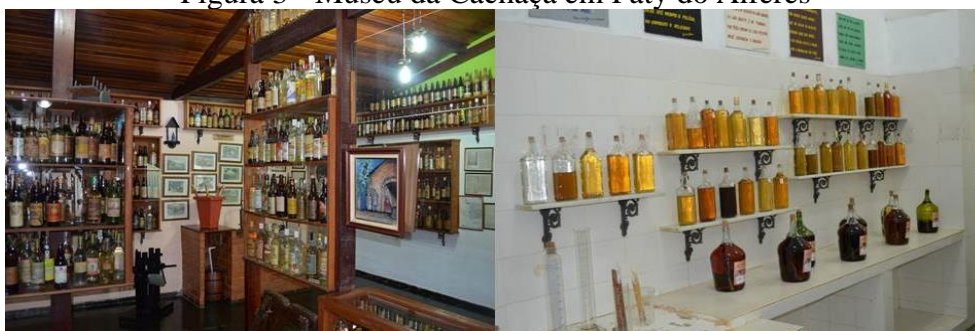
Figura 3 - Museu da Cachaça em Paty do Alferes