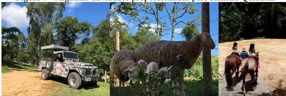
Figura 7 - Algumas atividades proporcionadas pelo Rancho Quindins