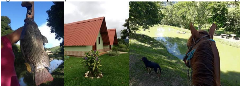
Figura 5 - Acomodações e ambiente da Pousada Pesque e Pague Vista Alegre