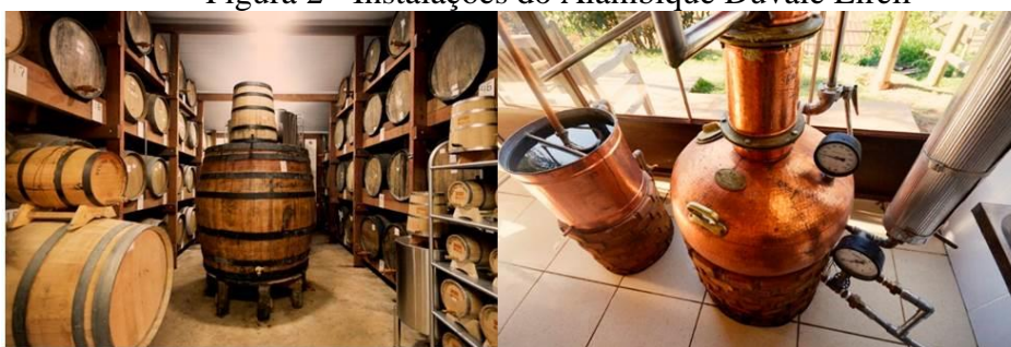
Figura 2 - Instalações do Alambique Duvale Eireli