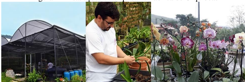
Figura 4 - Instalações do orquidário Fábrica de Orquídeas