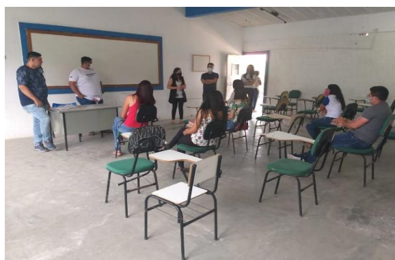
Figura 1: Encontro na escola seguindo protocolos.

Apresentamos nas figuras abaixo alguns dos momentos vividos na escola parceira em nossa realidade remota, buscamos sempre o melhor para todos.